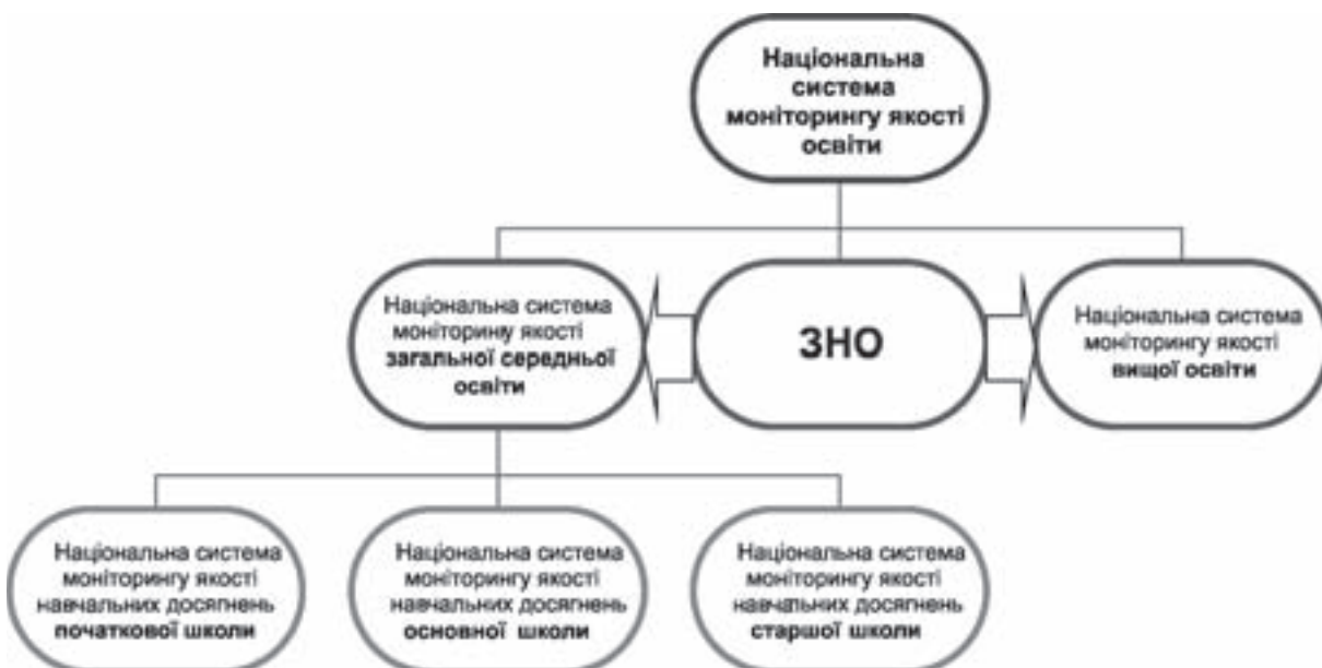
Рис. 2. Національна система моніторингу якості освіти

Навіть наведені приклади засвідчують спроможність ЗНО забезпечувати навчальні