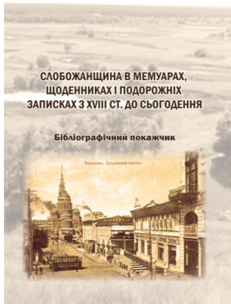
Рис. 6. Обкладинка книги «Слобожанщина в мемуарах, щоденниках і подорожніх записках з XVIII ст. до сьогодення»

На заключному пленарному засіданні було підбито підсумки форуму та ухвалено резолюцію про необхідність всебічної популяризації спадщини родини Алчевських як на місцевому, так і на загальноукраїнському рівні. Так, пропонується позначити QR-кодами з історичними довідками усі будівлі та пам'ятки, пов'язані з діяльністю роду, пропонувати учням Харківщини тематичну екскурсію «Нетлінний спадок родини Алчевських» у рамках вивчення курсу «Харківщинознавство» і включити до об'єктів показу оглядової екскурсії містом пам'ятник Олексію Алчевському та будинок недільної школи Христини Алчевської.