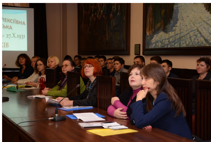
Рис. 2. Учасники конференції на пленарному засіданні.

Конференція мала меморіальний характер і була присвячена 175-річчю від дня народження видатної просвітительки, організаторки народної освіти, віце-президента Міжнародної ліги освіти Христини Данилівни Алчевської (1841–1920), 150-річчю композитора і музичного педагога Григорія Олексійовича Алчевського (1866–1920) та 140-річчю співака Івана Олексійовича Алчевського (1876–1917).