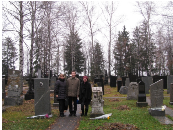
Рис. 3. Покладання квітів до могил Х. Д. Алчевської, І. О. Алчевського

Напередодні проведення конференції організатори здійснили покладання квітів до могил Х. Д. Алчевської, Х. О. Алчевської й І. О. Алчевського (Рис. 3).