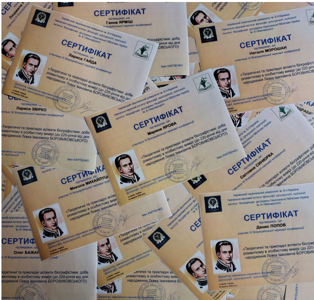
Рис. 2 Сертифікати учасників конференції Fig. 2 The conference participants' certificates

Тематика досліджень охоплювала різні виміри доби романтизму: філософську та історичну науки, етнографію, літературну творчість, живопис, пісенну і музичну творчість, танцювальне мистецтво. Біографічні студії були представлені доповідями, присвяченими Володимиру Боровиковському, Йогану Баптисту Шаду, Петру Гулаку-Артемівському, Олександру Зерніну, Тарасу Шевченку, Григорію Квітці-Основ'яненку, Ксаверу Моцарту. Спадок і творча біографія центральної постаті конференції Левка Боровиковського були в центрі уваги доповідей «Український колорит у перекладах і переспівах Левка Боровиковського» Олени Дудки, «Другий епод Горація в інтерпретації Левка Боровиковського: генеза буколічних мотивів» Орислави Івашків-Ващук, «Художник і поет: два Боровиковських в історії Харківського університету» Сергія Куделка, «Нарис Л. Боровиковського «Женская доля по малороссійскимъ пѣснямъ» (1867): емпірична типологія жіночих образів в українській народній ліриці» Руслани Мариняк, «Повсякденність доби Романтизму в творчості Левка Боровиковського» Ольги Новик, «Романтизм у живописі та поезії: творчі перетини митців з родини Боровиковських» Юліани Полякової, «З родини поета-романтика: художник Володимир Боровиковський» Людмили Ромащенко.