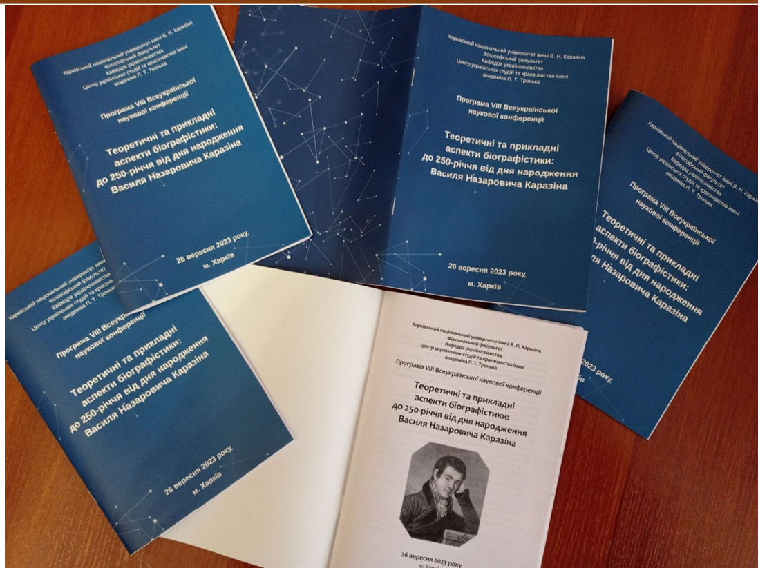
Рис. 4. Програма конференції

Після завершення пленарного засідання учасники перейшли до роботи в секціях. На конференції їх було організовано три: « Василь Назарович Каразін: життєпис, соціальне оточення, творча спадщина » (модератори О. І. Вовк та С. О. Синюрка), « Теоретична біографістика » (модератори Р. С. Мариняк та М. Є. Домановська), « Освіта, наука, культура через призму біографістики » (модератори О. Г. Павлова та О. М. Янкул).