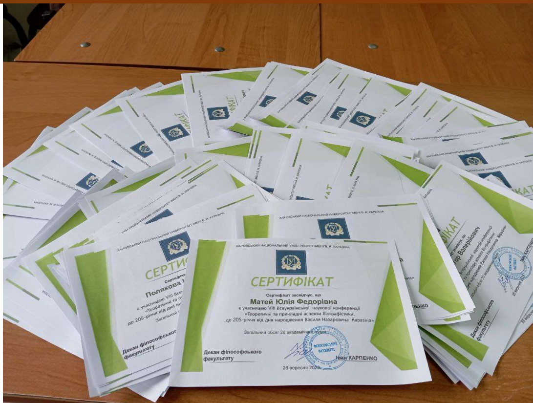
Рис. 5. Сертифікати учасників конференції

У цілому можна констатувати, що VIII Всеукраїнська наукова конференція «Теоретичні та прикладні аспекти біографістики: до 250-річчя від дня народження Василя Назаровича Каразіна», як і завжди, пройшла на високому організаційному і змістовному рівнях. Усім доповідачам були видані сертифікати про участь у конференції. Автори у своїх виступах розкрили нові, малодосліджені сторінки каразінознавства, підняли цікаві й актуальні проблеми української історичної біографістики, що ще раз підкреслило важливість і затребуваність цього напрямку досліджень.