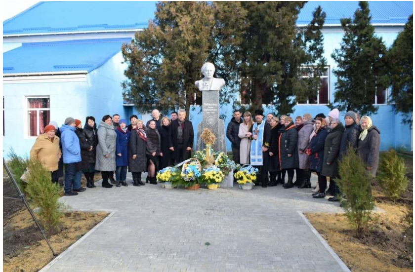
Рис. 2. Урочисте відкриття погруддя Євгена Чикаленка в с. Мардарівка Одеської обл. (3 грудня 2021 року)

Вона зазначила, що на сьогоднішній день ще не написана детальна та розгорнута біографія Є. Х. Чикаленка, яка б відображала всі грані його діяльності. Дослідження його переписки є одним із ключів для вирішення цього важливого та актуального завдання.