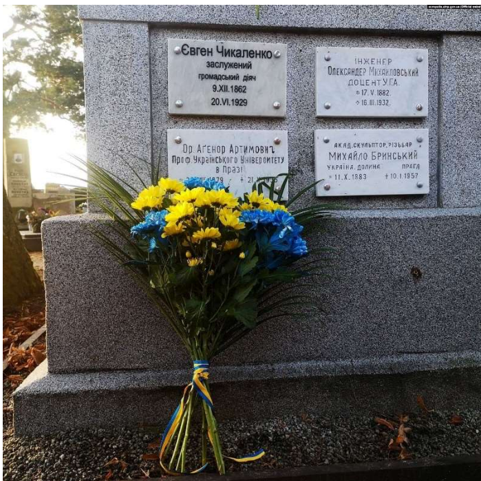
Рис. 3. Колумбарій у м. Подебради (Чеська Республіка) з прахом Євгена Чикаленка

Доктор історичних наук, професор, завідувач кафедри українознавства Каразінського університету Д. М. Чорний презентував доповідь «Харків та Харківський університет в житті Є. Х. Чикаленка: матеріали до щоденникових записів видатного українця». Автор дослідив історію перебування видатного підприємця і мецената в Харкові, особливості його соціального оточення, коло найближчих друзів з числа студентів і викладачів Харківського університету, специфіку й еволюцію ставлення Є. Х. Чикаленка до Харкова.