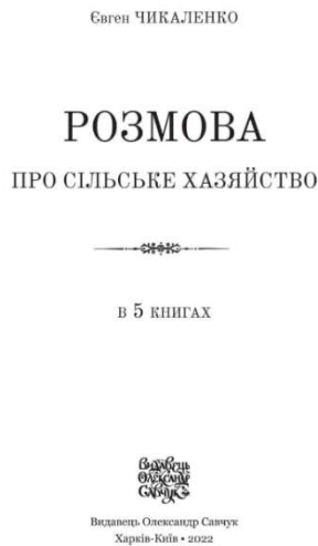
Рис. 4. Перевидання бестселера Євгена Чикаленка

Організатори та учасники конференції впевнилися в необхідності подальшої активізації та об'єднанні зусиль учених і практиків різного профілю з увічнення пам'яті видатного сина українського народу Євгена Чикаленка.