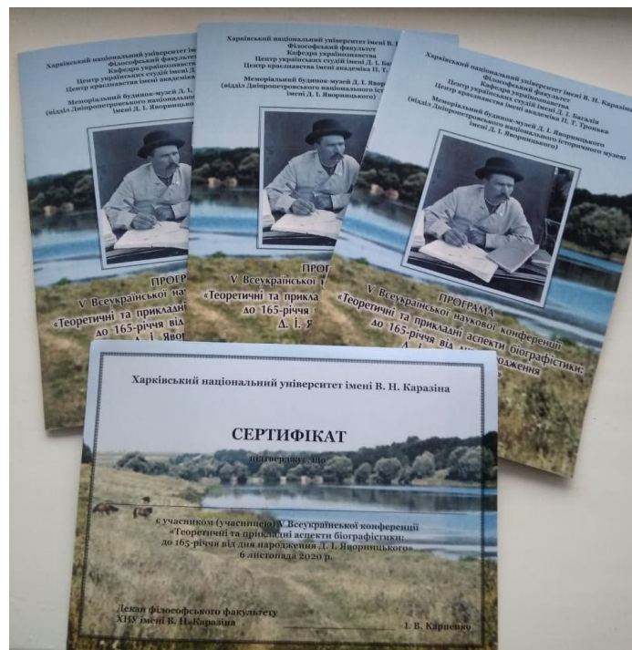
Рис. 1. Програма і сертифікат учасника Всеукраїнської наукової конференції «Теоретичні та прикладні аспекти біографістики: до 165-річчя від дня народження Д. І. Яворницького»

Цього року співорганізаторами конференції виступили наукові та освітні інституції з Харкова та Дніпра. Харківський національний університет імені В. Н. Каразіна був представлений філософським факультетом (зокрема, кафедрою українознавства), Центром українських студій імені Д. І. Багалія та Центром краєзнавства імені академіка П. Т. Тронька. Від Дніпра до команди організаторів плідно долучилися представники Меморіального будинку-музею Д. І. Яворницького.