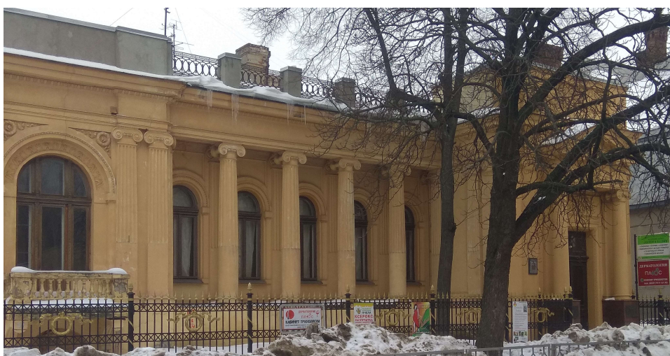
Фасад будинку купця Рижова

Садибу біолога Д. Алчевського (Дарвіна, 13) у мавританському стилі спроектував О. Бекетов. Фасад стримано прикрашений орнаментом, схожим на фортечні мури. Завдяки величезним вікнам на другому поверсі освітлено верхні покої, де могли бути кімнати господарів, кабінет тощо. Так само вхід до садиби з масивними стінами подібний до брами середньовічної фортеці. Дах зі шпилями довершує загальний вигляд будівлі.