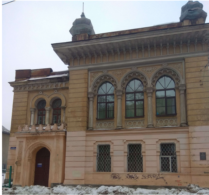
Фасад будинку біолога Алчевського

Приватне помешкання, у якому жив архітектор О. Бекетов (Дарвіна, 37), збудоване у неоренесансному стилі, загалом має ті самі елементи, що й купецькі будинки цього стилю – вхід, який тримають колони, ліпнину з міфічними сюжетами тощо. Проте в оздобленні є й доволі цікаві барокові символи – химерні риби, сонце з людським обличчям. Вікна однакові завширшки, але завдяки розташуванню будинку на півповерсі, перехожому з вулиці доволі складно побачити внутрішнє життя мешканців. Форма даху візуально збільшує його висоту.