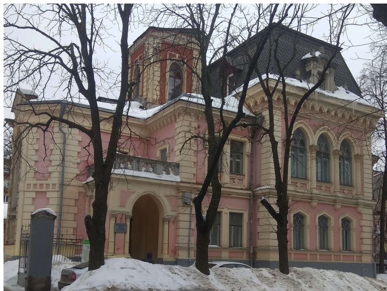
Фасад будинку орнітолога Сомова

другого поверху й башточка з вікнами з усіх боків сприяє як освітленню, так і, може, орнітологічним дослідженням. Вхід до будинку прикрашають кругла арка й колони.