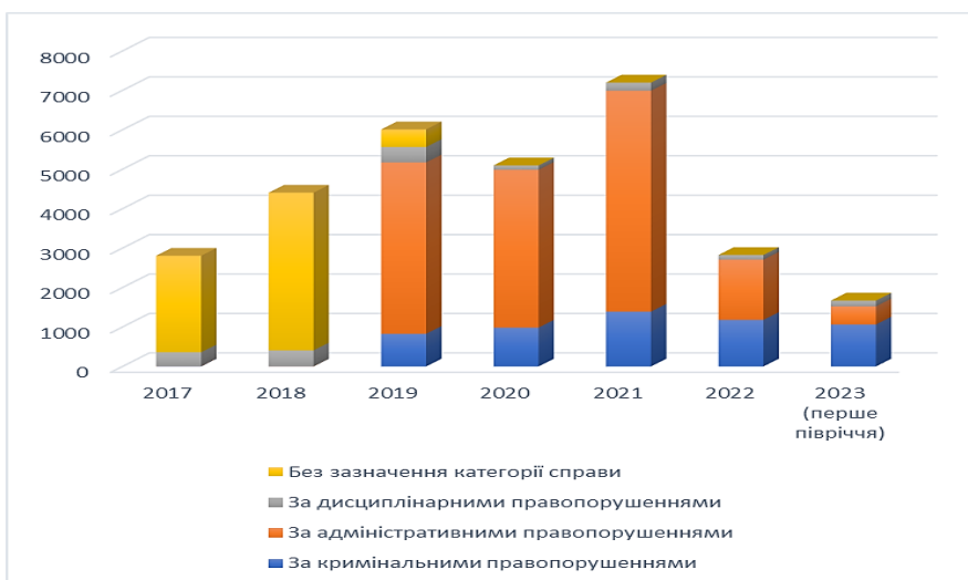
Рисунок 1. Динаміка кількості корупційних правопорушень в Україні [6, 7]

Пропонуємо в Україні запровадити аналіз показників, згрупованих за регіонами з точки зору ринку корупції бізнесу та інтенсивності завершення корупційних операцій. Такий аналіз показників активності бізнесу та корупції для українських регіонів може викрити ступінь потенціалу прихованого ділового обороту у різних регіонах і, в той же час, має поєднати рівень корупції та бізнесу через індикатори ваги конкретних показників валового регіонального продукту, обсягу інвестицій та зовнішніх торговельних показників на душу населення.