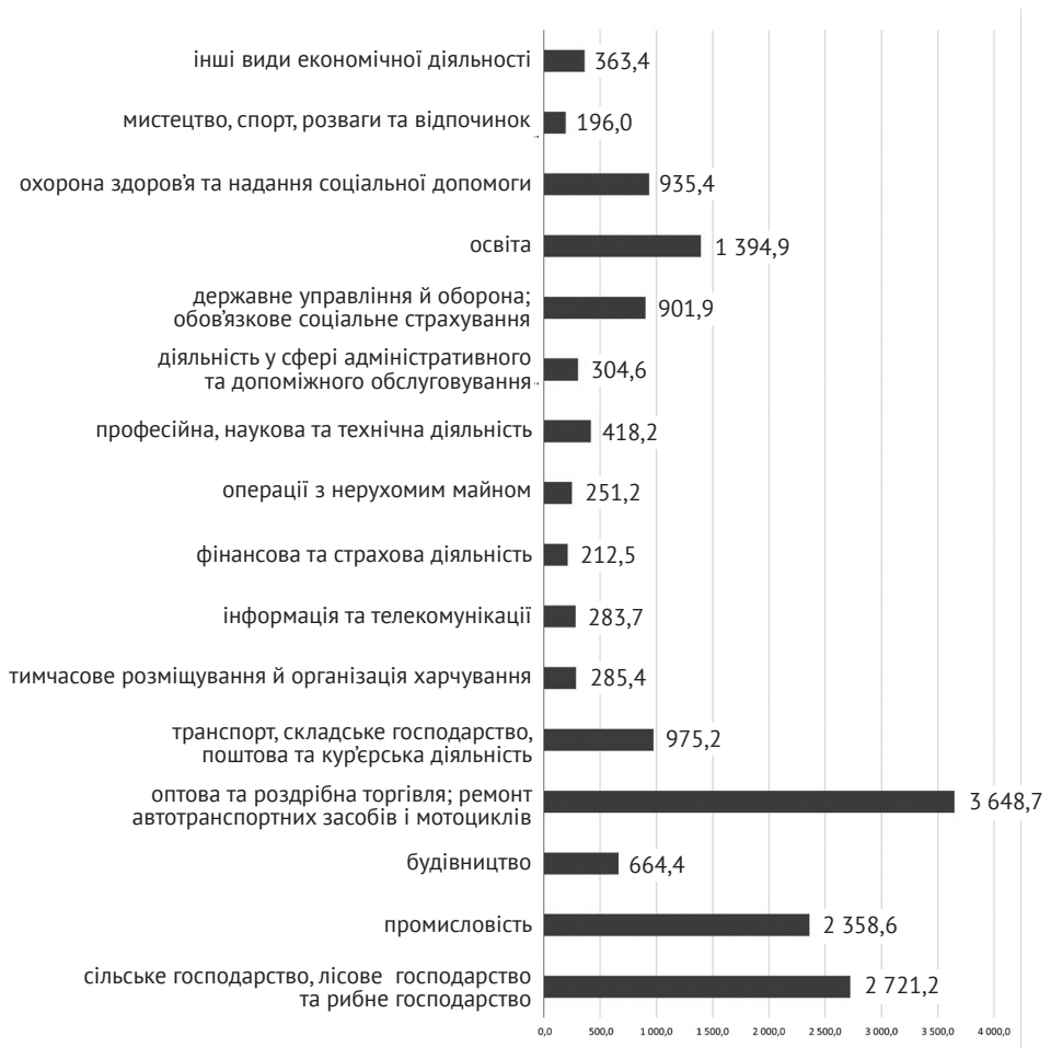
Рисунок 1. Зайнятість населення по видах економічної діяльності в Україні, тис. осіб