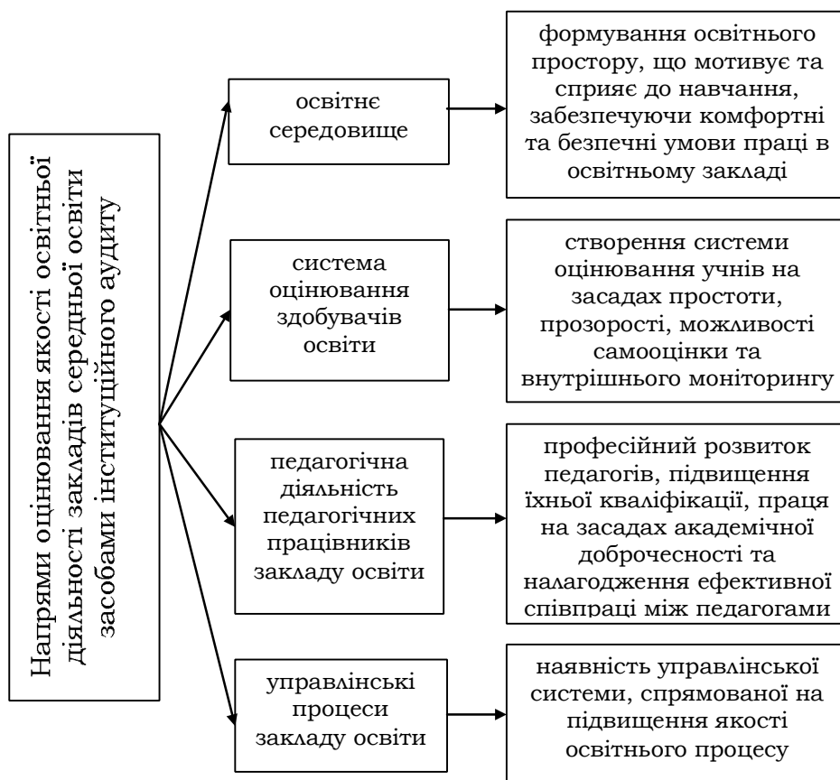
Рис. 2. Напрями оцінювання освітніх і управлінських процесів закладу освіти та внутрішньої системи забезпечення якості освіти.

Процедура здійснення інституційного аудиту включає в себе оцінювання якості освітньої діяльності закладів середньої освіти за основними напрямками, які показано на рис. 2.