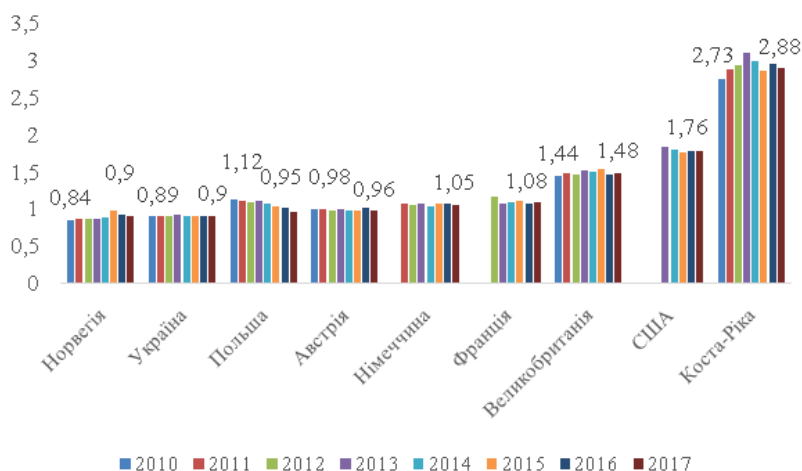
Рис. 3. Індекс (коефіцієнт) Пальми у 2010–2017 рр. Складене авторами за [16; 17]