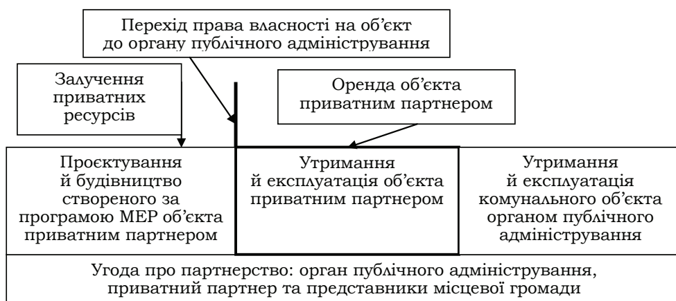
Рис. 1. Організаційно-функціональна схема умов створення партнерства BOT під час реалізації програми МЕР: будівництво, модернізація, передача у власність держави й експлуатація

Першим кроком у розробленні такої організаційно-функціональної моделі є встановлення органами публічного адміністрування умов створення партнерства в частині визначення обсягів, необхідних для розвитку ресурсів та забезпечення прав власності місцевої громади на об’єкти, що будуть створені [1]. Відповідну модель адміністрування процесом МЕР на засадах моделі ППП: Build, Operate, Transfer (BOT) подано на рис. 1.