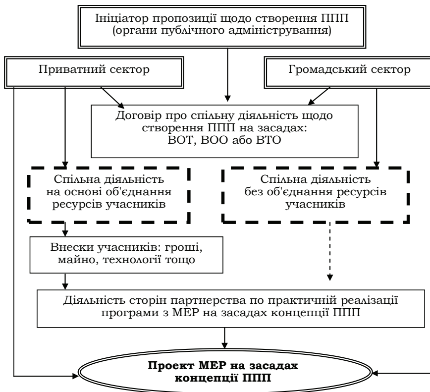
Рис. 2. Модель застосування концепції PPP у програмах МЕР