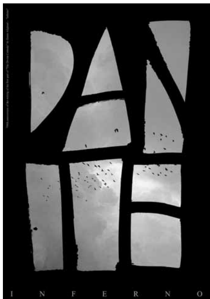
Номінація «Екологія культури». Заохочувальна премія. Юрій Торев (Білорусь)