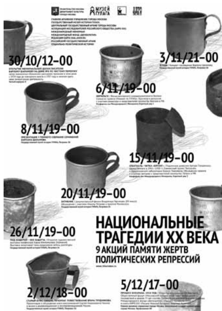
Номінація «Екологія культури». Друга премія. Татяна Метелік (Росія)