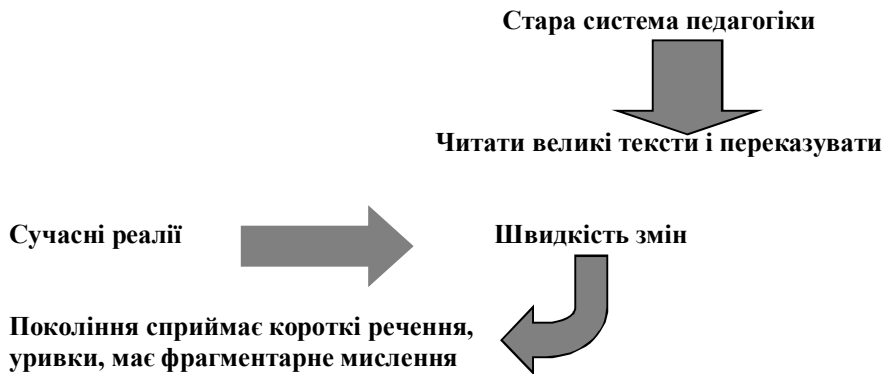
Рисунок 4. Схематичне обґрунтування системи педагогіки

Власне, такий підхід означає, що робота ведеться в сучасній системі педагогіки, характерній, зокрема для європейського простору. Про це докладно йшлося на семінарі на тему: «Метод усної історії при вивченні новітньої історії», що проводився Центром усної історії Київського національного університету імені Тараса Шевченка, Дослідницьким інститутом тоталітарних режимів (USTR) Чеської Республіки та за підтримки Асоціації з міжнародних питань та програми TRANS МЗС Чеської Республіки (19.12.2014). Окремим блоком в рамках семінару розглядалися основи та принципи рефлексивної педагогіки та активні методи у навчанні. Застосування саме такої системи педагогіки може бути обґрунтовано схематично (див. рис. 4).