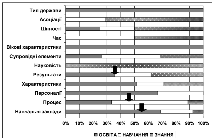
Рисунок 2. Типологізація асоціативних полів для слів-маркерів «освіта»-«навчання»-«знання»