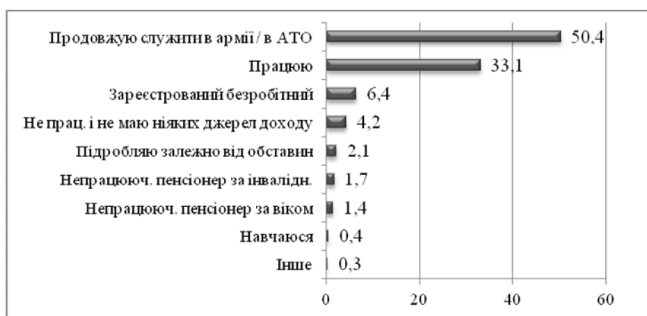
Рисунок 1. Основний тип зайнятості ветеранів АТО (N=904, % до тих, хто відповів)

Основними причинами, через які ветерани АТО не працюють, були названі такі, як відсутність у місці їх проживання вільних/прийнятних робочих місць (36,3%) та неможливість працювати через проблеми зі здоров'ям (28,1%) (табл. 2).