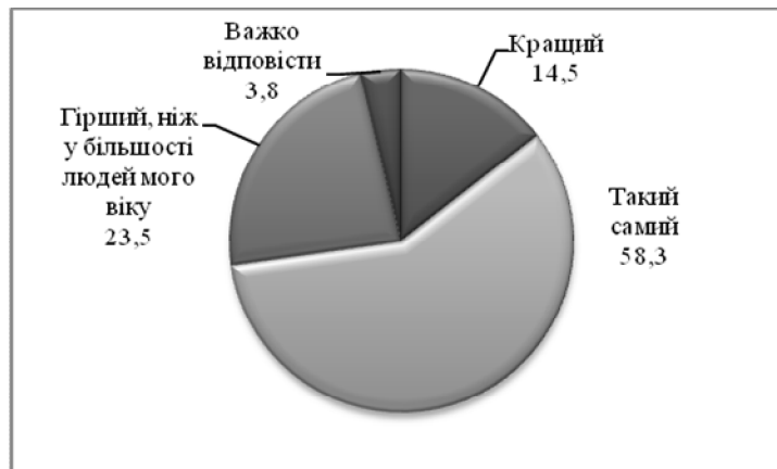
Рисунок 2. Самооцінка здоров'я ветеранів у порівнянні з ровесниками (N=904; %)

Проблеми ветеранів АТО, пов'язані зі здоров'ям. Характеризуючи стан свого здоров'я, трохи більше половини опитаних (58,3 %) оцінили його як таке, що мають й інші їхні ровесники, в той час як майже чверть ветеранів вважають, що мають більш серйозні проблеми зі здоров'ям (рис. 2).