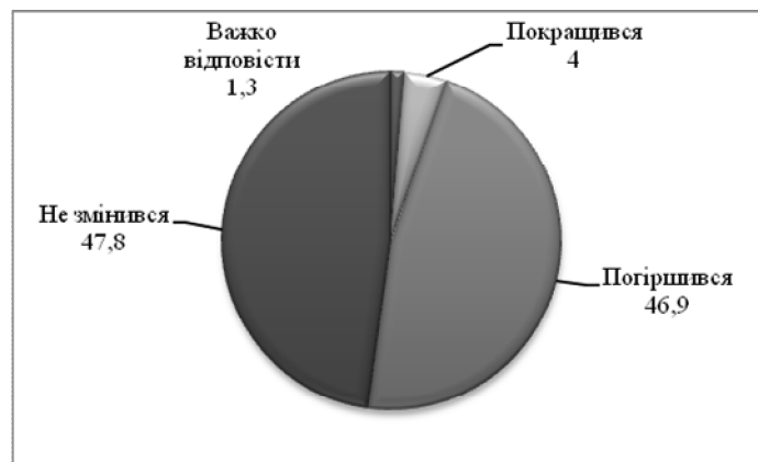
Рисунок 3. Самооцінка динаміки стану здоров'я у зв'язку із перебуванням у зоні АТО (N=904, %)

Також в ході дослідження ми намагалися з'ясувати, як, на думку респондентів, перебування в АТО вплинуло на стан їхнього здоров'я. Так, 46,9% опитаних вважає, що стан їх здоров'я погіршився внаслідок перебування у зоні АТО, практично стільки ж (47,8%) не бачать суттєвих змін, а 4% опитаних ветеранів навіть відчули позитивні зміни (рис. 3).