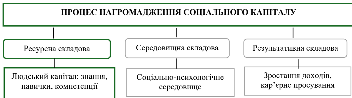
Рисунок 2. Складові процесу нагромадження соціального капіталу персоналу

Але соціальний капітал персоналу – це не лише показник його успішності, але й ресурс, який постійно розвивається завдяки активній соціальній і професійній діяльності. Сам процес нагромадження соціального капіталу персоналу можна представити як взаємодію трьох складових: ресурсної, середовищної та результативної [3]. Ці компоненти тісно пов'язані між собою, взаємодоповнюють одна одну й виявляються у процесі формування та використання соціального капіталу (рис. 2).