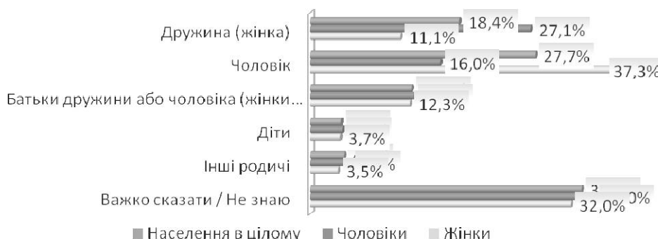
Рисунок 2. Розподіл респондентів за відповідями на питання стосовно ініціаторів насильства в сім'ї

Запитання стосовно ініціаторів насильства в сім'ї – це одне з небагатьох запитань, де найбільш поширена відповідь – «важко сказати» (ймовірно, через те, що ці респонденти вважають, що у їхніх родинах насильства в сім'ї немає) – 33%. Виокремлюються три основні типи провокаторів насильства в сім'ї: чоловік (28%), дружина (18%) і батьки дружини або чоловіка (13%). Діти та інші родичі значно рідше бувають провокаторами. Характерно, що жінки частіше за чоловіків вважають провокаторами саме чоловіків (37% проти 16% відповідно), а чоловіки частіше за жінок – саме дружин (27% проти 11% відповідно) (див. рис. 2).