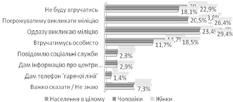
Рисунок 3. Розподіл респондентів за відповідями на питання, що вони робитимуть, коли в родині сусіда відбуватиметься насильство

В уявленнях мешканців Криму найбільш виправдана реакція на насильство у родині сусіда – звернення до міліції: 24% стверджують, що погрожуватимуть викликати міліцію, а 27% стверджують, що викличуть міліцію одразу. Неформальний соціальний контроль у вигляді особистого втручання виглядає малопоширеним – до нього готові тільки 15%, та й то на словах. Про брак соціальної згуртованості або поширеність соціальної байдужості свідчить і те, що 20% взагалі не втручатимуться. Однак чоловіки й жінки зорієнтовані реагувати по-різному: якщо жінки більше, ніж чоловіки, схильні звертатись до формальних інституцій соціального контролю – погрожувати або одразу викликати, то чоловіки більше за жінок схиляються до протилежних тактик поведінки – не втручатись або втручатись особисто (див. рис. 3).