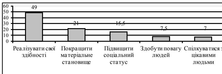
Рисунок 2. Уявлення студентів про можливості, які дає людині вища освіта (в %)

Можливо, саме за цих причин опитані нами студенти досить низько оцінили значущість вищої освіти (у всякому разі культурно-мистецької) для особистості (див. рис 2).