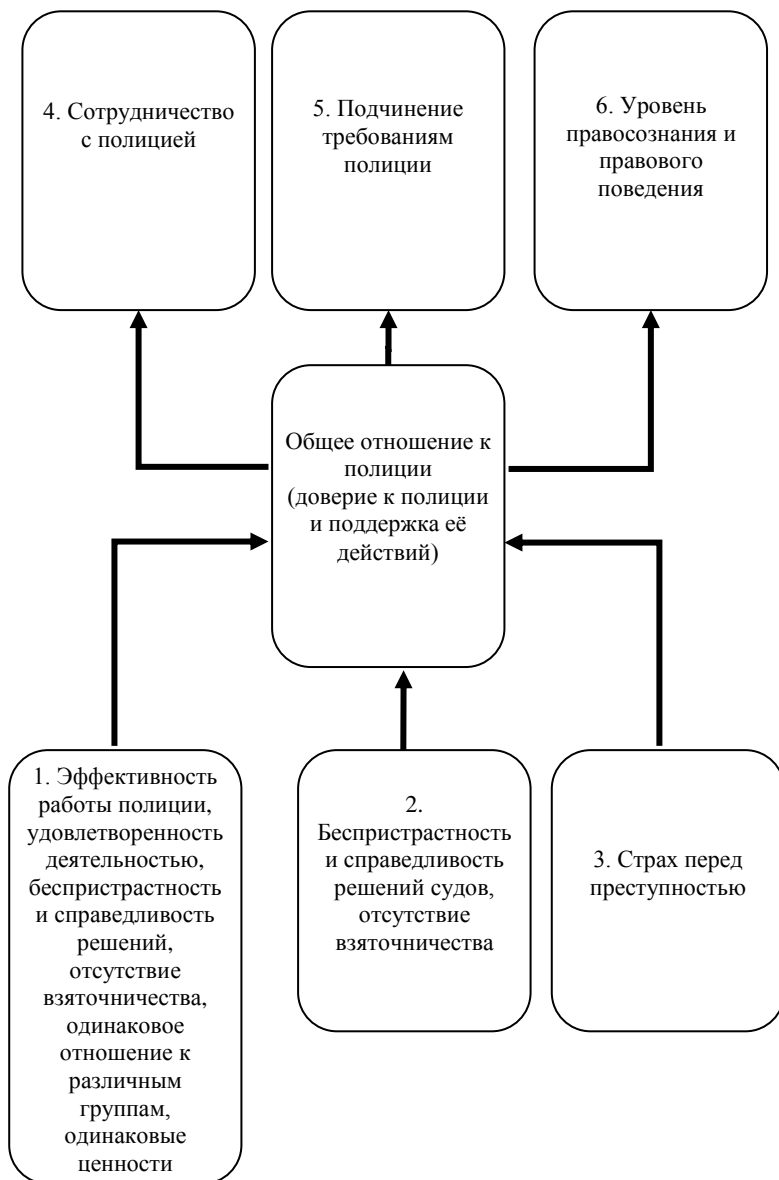
Рисунок 1. Схема связей общего отношения населения к полиции (милиции)

В таблице 1 содержатся парные коэффициенты корреляции Пирсона и их статистическая значимость, которые демонстрируют связь показателей, характеризующие разнообразные установки по отношению к украинской милиции со степенью доверия к ней. Показатель доверия к милиции имеет умеренную статистически значимую корреляционную связь с оценкой населения её работы и последняя переменная имеет такую же структуру связей, (с учетом порядка шкалы) с другими переменными, поэтому можно говорить об общем отношении населения к милиции. Номинальные шкалы вопросов об обращении милиции с потерпевшими различной классовой и национальной принадлежности для удобства были преобразованы в дихотомические.