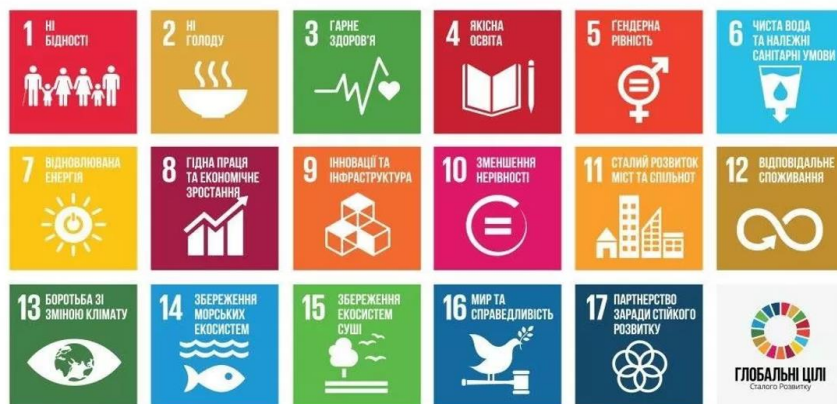
Рисунок 1. Глобальні цілі сталого розвитку

Як вже зазначалося, вагома частина принципів стосується екологічної поведінки та збереження навколишнього середовища. В цьому напрямку у 2008 році почала працювати французька екоактивістка Беа Джонсон. Проблемою світового масштабу є постійне збільшення відходів, що чинять вплив на навколишнє середовище (або чинитимуть вплив у найближчій перспективі), але ці відходи – це не тільки результати діяльності великих чи середніх підприємств, компаній тощо. Це, в тому числі, результат діяльності кожного окремого індивіда чи домогосподарства. Ідея Беа Джонсон полягає в тому, що, якщо кожна людина мінімізує кількість власних відходів, тоді і на глобальному рівні їхня кількість буде мінімізована. Такий підхід вона називає стилем життя «нуль відходів». У 2013 році вона видала книгу «Zero Waste Home: The Ultimate Guide to Simplifying your Life by Reducing your Waste» [2], яка була перекладена більш ніж 20-ма мовами. В книзі авторка розповідає, яким чином кожне домогосподарство може зменшити кількість відходів. Метод, який вона винайшла, має назву принцип «5R». Його можна зобразити у вигляді піраміди: