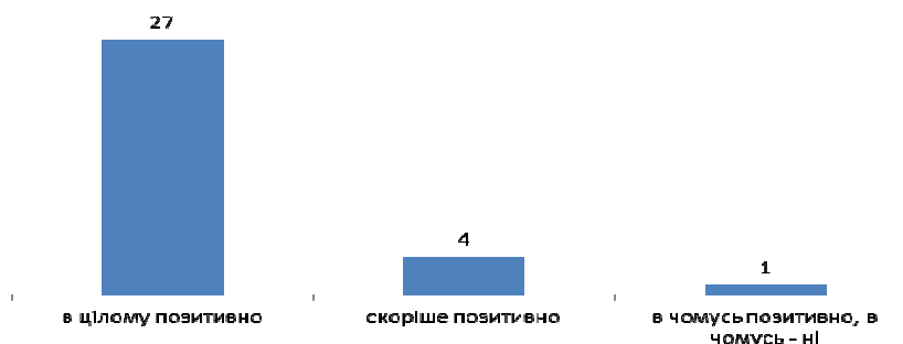
Рисунок 2. Розподіл відповідей на запитання «Як Ви оцінюєте в цілому роботу з внутрішньо переміщеними особами Вашої організації?» (абсолютне значення, n=32)

Високою виявилася й оцінка діяльності соціальної служби, яку пропонували виставити в балах за 10-ти бальною шкалою. Середня оцінка становила 9 балів.