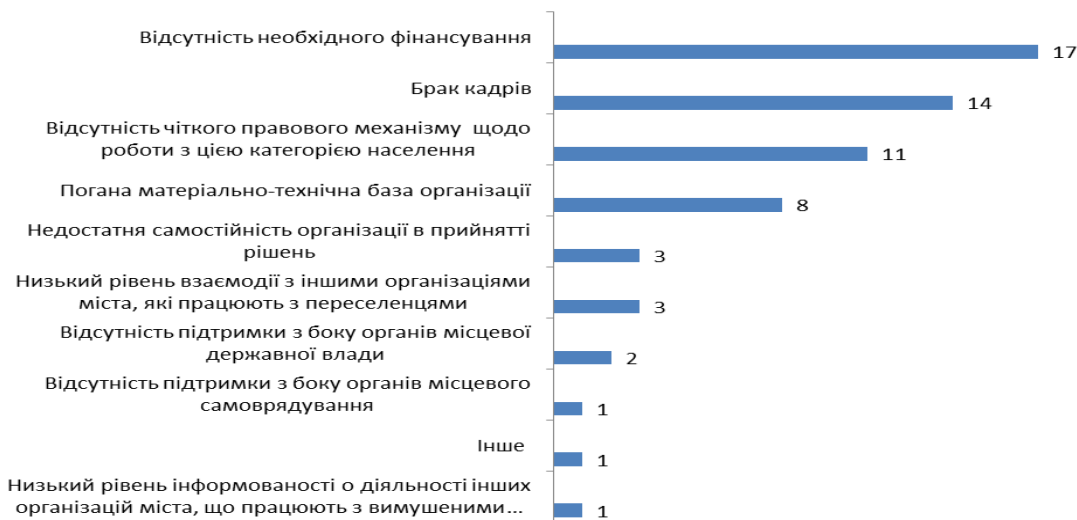
Рисунок 4. Проблеми, що виникають у організації в роботі з внутрішньо переміщеними особами (абсолютне значення, n=32)

До головних проблем, які виникають в роботі з внутрішньо переміщеними особами на організаційному рівні (тобто рівні всієї організації) опитані віднесли наступні: відсутність необхідного фінансування, брак кадрів, відсутність чіткого правового механізму щодо роботи з цією групою населення.