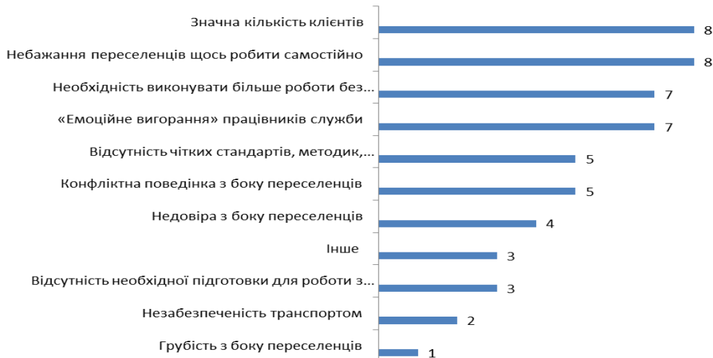
Рисунок 3. Проблеми, що виникають у працівників соціальної служби в роботі з внутрішньо переміщеними особами (абсолютне значення, n=32)

необхідність виконувати більше роботи без додаткової винагороди. Працівники територіальних центрів найчастіше звертали увагу на такі проблеми в своїй діяльності, як утриманські настрої з боку внутрішньо переміщених осіб, а також недовіру з їх боку.