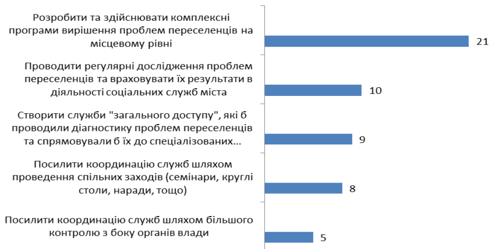
Рисунок 5. Розподіл відповідей на запитання «Що необхідно зробити в м. Харкові для того, щоб покращити роботу з внутрішньо переміщеними особами?» (абсолютне значення, n=32)

Висновки. Таким чином, як свідчать отримані дані, соціальні служби міста Харкова опинилися в складній ситуації. З одного боку, в них збільшився об'єм роботи, дещо змінилася специфіка діяльності у зв'язку з необхідністю надавати нові послуги та працювати з новою групою клієнтів. З іншого боку – додаткового фінансування переважна більшість з них не отримала. В такій ситуації, на нашу думку, актуальності набувають наступні напрями подальших соціологічних досліджень: