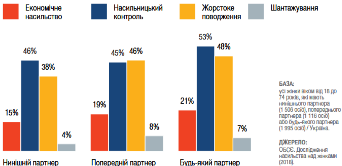
Рис. 2. Рівень поширеності різних форм психологічного насильства [3]

психологічного насильства з боку нинішнього або попереднього партнера 3 . Психологічне насильство проявлялося у надмірному контролі поведінки (53% від опитаних) та словесних образах та приниженні (48%). Кожна п'ята жінка (21%) зазначила, що вона потерпала від економічного насильства, і 7% жінок, у яких був або є партнер і які мають дітей, зазначили, що їх шантажували, використовуючи їхніх дітей, або з їхніми дітьми жорстоко поводитись.