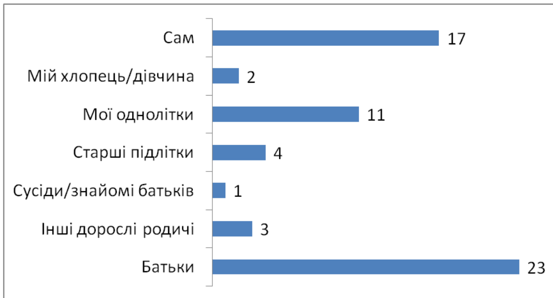
Рисунок 2 Розподіл відповідей учнів школи на запитання «Хто вперше дав Вам спробувати алкогольні напої?», N=60

Майже половина учнів відчувала стан алкогольного сп'яніння. 14 підлітків відзначили, що досить часто й зараз вживають алкоголь. 26 підлітків відзначили, що їх батьки знають про вживання ними алкогольних напоїв. При цьому 25 учнів відзначили, що батьки ставляться до цього негативно, а 15 учнів відзначили, що їх батьки ставляться до цього нейтрально. Позитивне ставлення відзначили з боку батьків лише 3 підлітків.