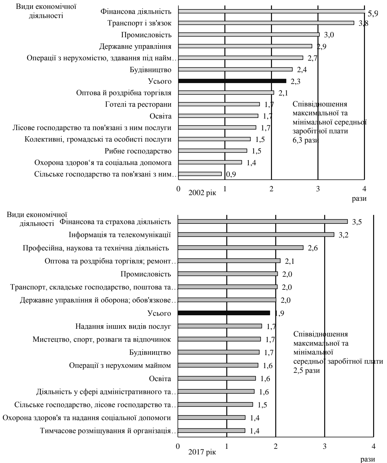
Рисунок 2 – Співвідношення середньомісячної та мінімальної заробітних плат за видами економічної діяльності на початок року (розраховано автором за даними [8])

як особистості, так і підприємств, бути важелем гармонійному розвитку суспільства, високих темпів економічного зростання.