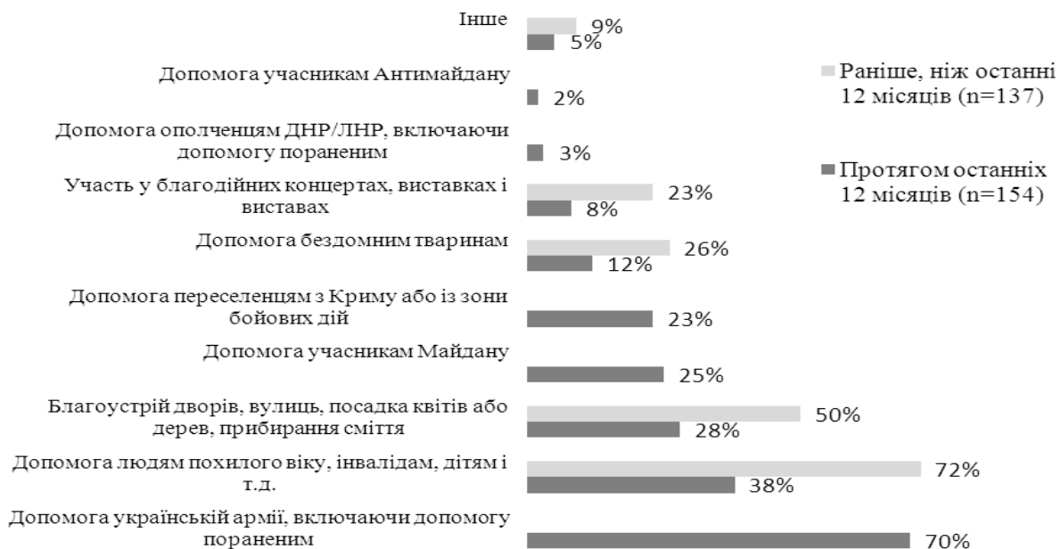
Рис. 2. Розподіл за напрямками волонтерських заходів, в яких брали участь українці, в 2014 році й раніше [14]

На користь такого терміну свідчить також результат дослідження GfK Ukraine, в якому рівень підтримки української армії, пораненим та їхнім родичам склав у 2014 році найбільший відсоток задіяних осіб (див. Рисунок 2).