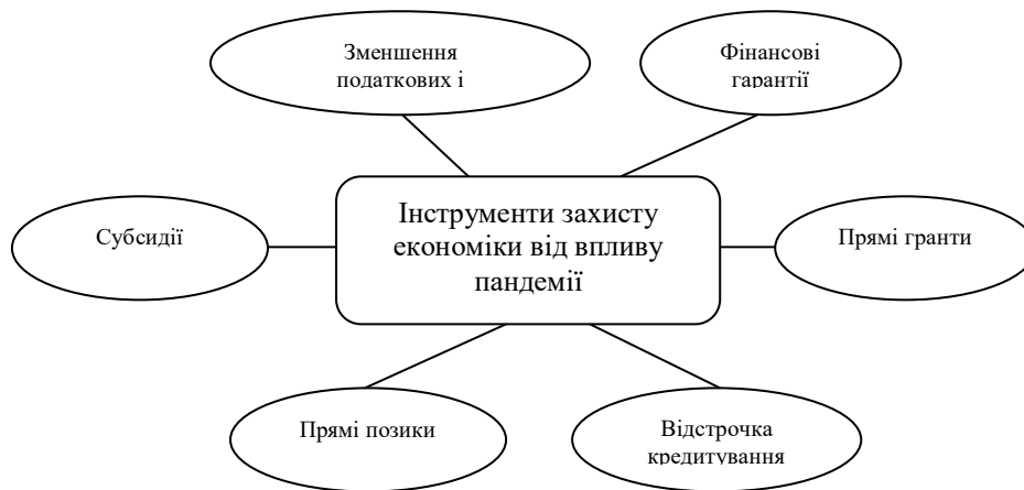
Рис. 4. Інструменти захисту економіки від впливу пандемії Fig. 4. Tools to protect the economy from the effects of a pandemic

Створення нових систем кредитування або ведення переговорів з банками щодо нових позик, більшість з яких спрямовані на забезпечення грошових потоків для МСП. Однак відповідь МСП показує, що позики, які підлягають поверненню, можуть бути складним вибором, особливо для найменших підприємств, оскільки в даний час вони не можуть прогнозувати свої доходи на решту року.