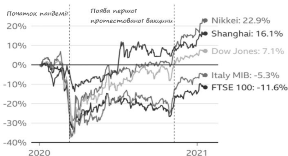
Рис 1. Вплив пандемії на світові фондові ринки

Мільйони робітників були залучені до програм збереження робочих місць, що підтримуються державою, оскільки такі частини економіки, як туризм, майже зупинились.