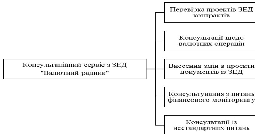
Рис. 3. Складові консультаційного сервісу «Валютний радник» (АТ «ПУМБ», n.d.)

ності «Валютний радник». Клієнт звертається за допомогою в банк і в результаті отримує рекомендації та розроблений проект зовнішньоекономічного контракту, підготовлений перелік документів для перерахування валюти і всі супутні консультації щодо зовнішньоекономічної діяльності. Основні його складові узагальнено на рис. 3.