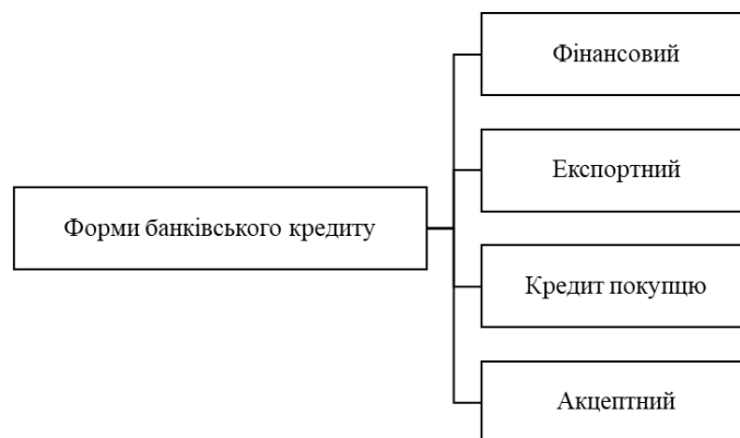
Рис. 1. Форми кредитування ЗЕД (Яценко, 2018)

прив'язаний до циклу здійснення торгової операції, банк повинен мати надійні іноземні банки-контрагенти та бути членом SWIFT та інших міжнародних платіжних систем, а також мати кваліфікований у сфері зовнішньоекономічної діяльності персонал.