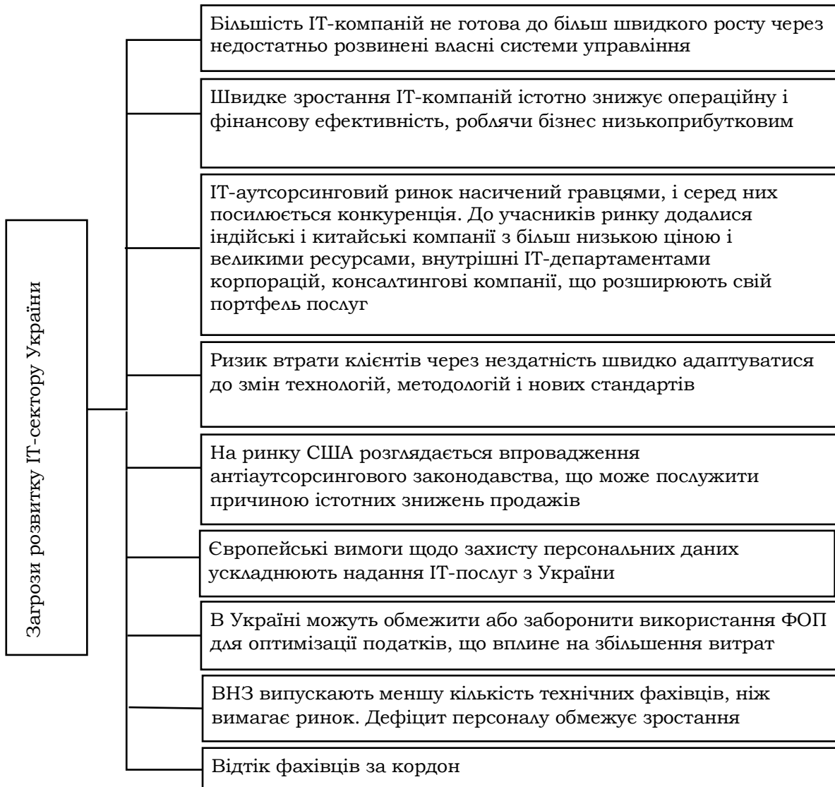
Рис. 2. Загрози розвитку ІТ-послуг в Україні

Внутрішні та зовнішні загрози розвитку ІТ-сектору згруповано на рис. 2.