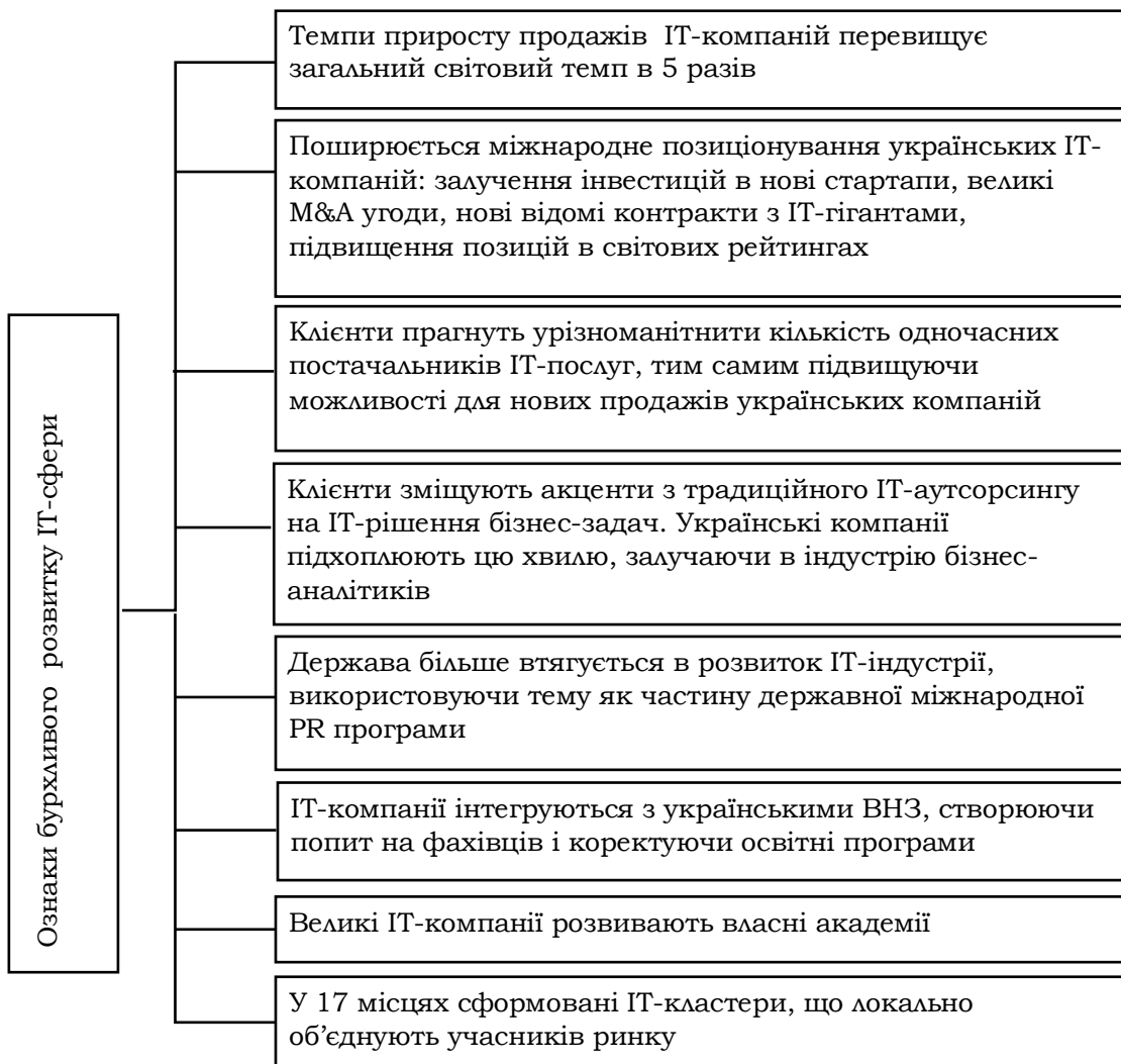
Рис. 3. Ключові фактори розвитку ІТ-послуг в Україні

Для покращення зовнішньоекономічної діяльності України, необхідно націлити сили держави та власників ІТ-компаній на розвиток внутрішнього ринку ІТ-послуг. Адже низький рівень внутрішнього ринку стримує розвиток зовнішніх відносин ІТ-сфери.