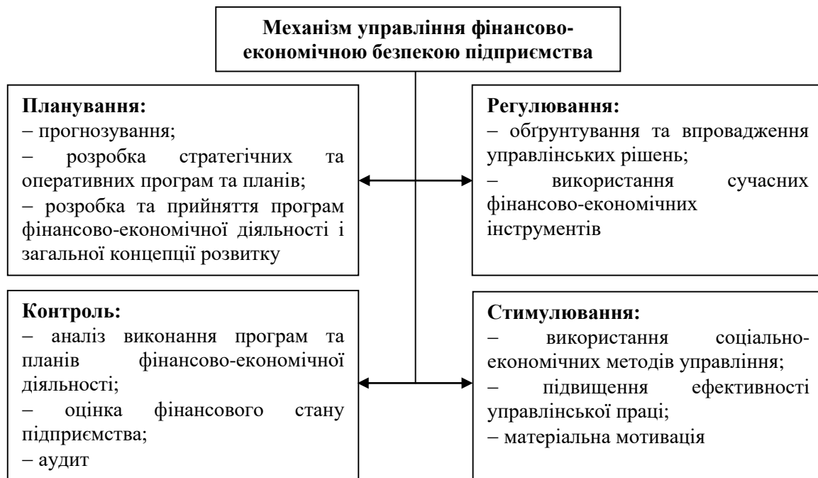
Рисунок 3 – Складові механізму управління фінансово-економічною безпекою будівельного підприємства

Своєчасне та точне оцінювання загроз фінансово-економічній безпеці будівельного підприємства, розробка та реалізація методів нейтралізації їх негативного впливу потребують побудови адекватного механізму управління фінансово-економічною безпекою, який повинен складатися з взаємопов'язаних процесів: планування, регулювання, контролю та стимулювання, які забезпечать фінансову та економічну стійкість підприємства (рис. 3).