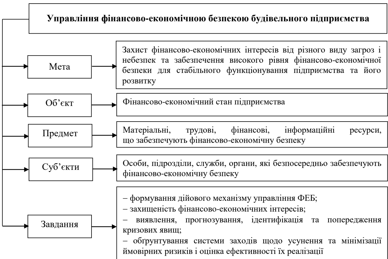
Рисунок 2 – Елементи управління фінансово-економічною безпекою будівельного підприємства

Цільовою спрямованістю управління фінансово-економічною безпекою будівельного підприємства є формування адаптивних реакцій на дію загроз у будь-якій сфері його життєдіяльності і, як наслідок, – забезпечення стабільного і максимально ефективного функціонування підприємства на цей момент часу та високого потенціалу розвитку в майбутньому.