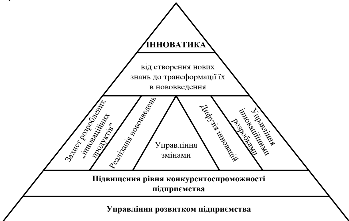
Рисунок 2 – Ієрархічна система впливу інноватики на управління розвитком підприємства

На рис. 2 наведено розроблену ієрархічну систему впливу інноватики на управління розвитком підприємством.