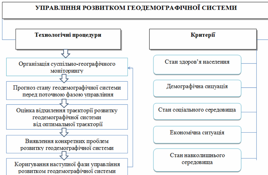
Рис. 2. Технологічні процедури та критерії управління розвитком геодемографічної системи (побудовано автором)

Висновки. Синергетичний погляд на проблеми геодемографічної системи переконує, що вони можуть і мають бути вирішені із застосуванням сучасних технологій і засобів соціального (суспільного) управління. За теорією соціоактогенезу, для цього потрібно чітко визначити і сформулювати мету майбутнього фазового переходу, побудувати несуперечливу систему цілей з урахуванням власних і наданих ресурсів, створити ефективну з точки зору оптимального використання наявних методів (технологій) та засобів діяльності виконавчу систему і контролювати та аналізувати отримання результату. Зміст кожної стадії соціоактогенезу детально розкрито, варто зауважити, що аналіз результатів соціального управління потребує кількісного опису і порівняння реального результату з його очікуваною моделлю (метою). Запропонована концепція геодемографічної системи регіону на основі дисипативних структур, до яких відносяться люди, групи людей, соціум (суспільство), спрямована на розвиток і функціонування досліджуваної системи, де особлива роль належить реалізації управлінських рішень. Дійсно, суспільство, яке прагне до суспільного прогресу, має піклуватися про систему відтворення населення, бо саме вона забезпечує фізично, духовно і морально майбутнє країни. З цієї точки зору стає зрозумілим, що неперервне відтворення нових поколінь креативних людей, з активною громадянською позицією, профе-