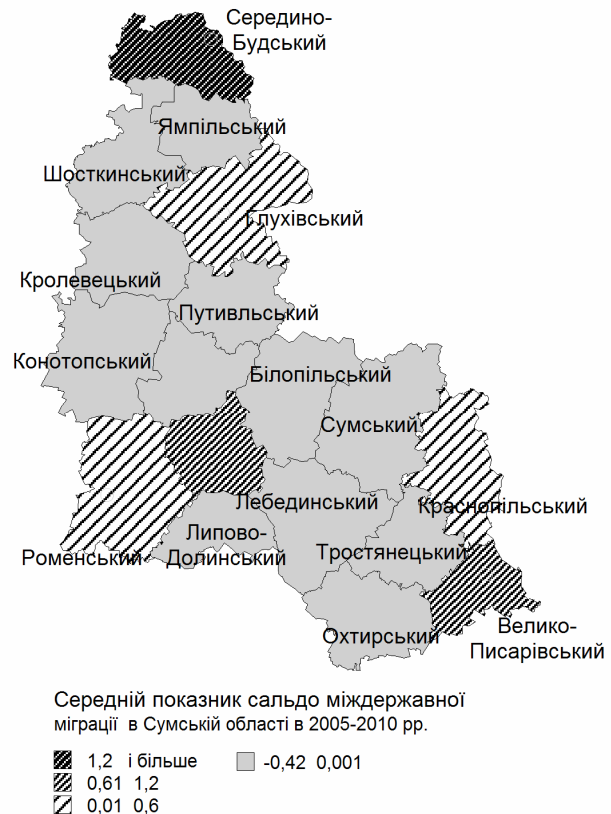
Рис. 3. Міждержавна міграція населення в Сумській області

Динаміка середньорічних значень сальдо міграції. Середньорічні значення сальдо внутрішньорегіональної міграції за останні 6 років (з 2005 до 2010 року) свідчать про те, що найбільший приріст населення спостерігається в Сумському, Охтирському, Шосткинському районах (найбільш розвинені в області), а також Тростянецькому районі (за рахунок притоку населення з сусідніх малорозвинених в економічному відношенні районів). Найбільший відтік характерний для Глухівського, Роменського (внаслідок спаду промислового виробництва, зростання рівня безробіття) та Буринському (економічно відсталому за всіма показниками) районах.