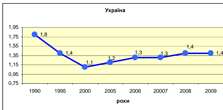
Рис. 3. Сумарний показник народжуваності в субрегіонах Українського Причорномор'я у 1990-2009 роках