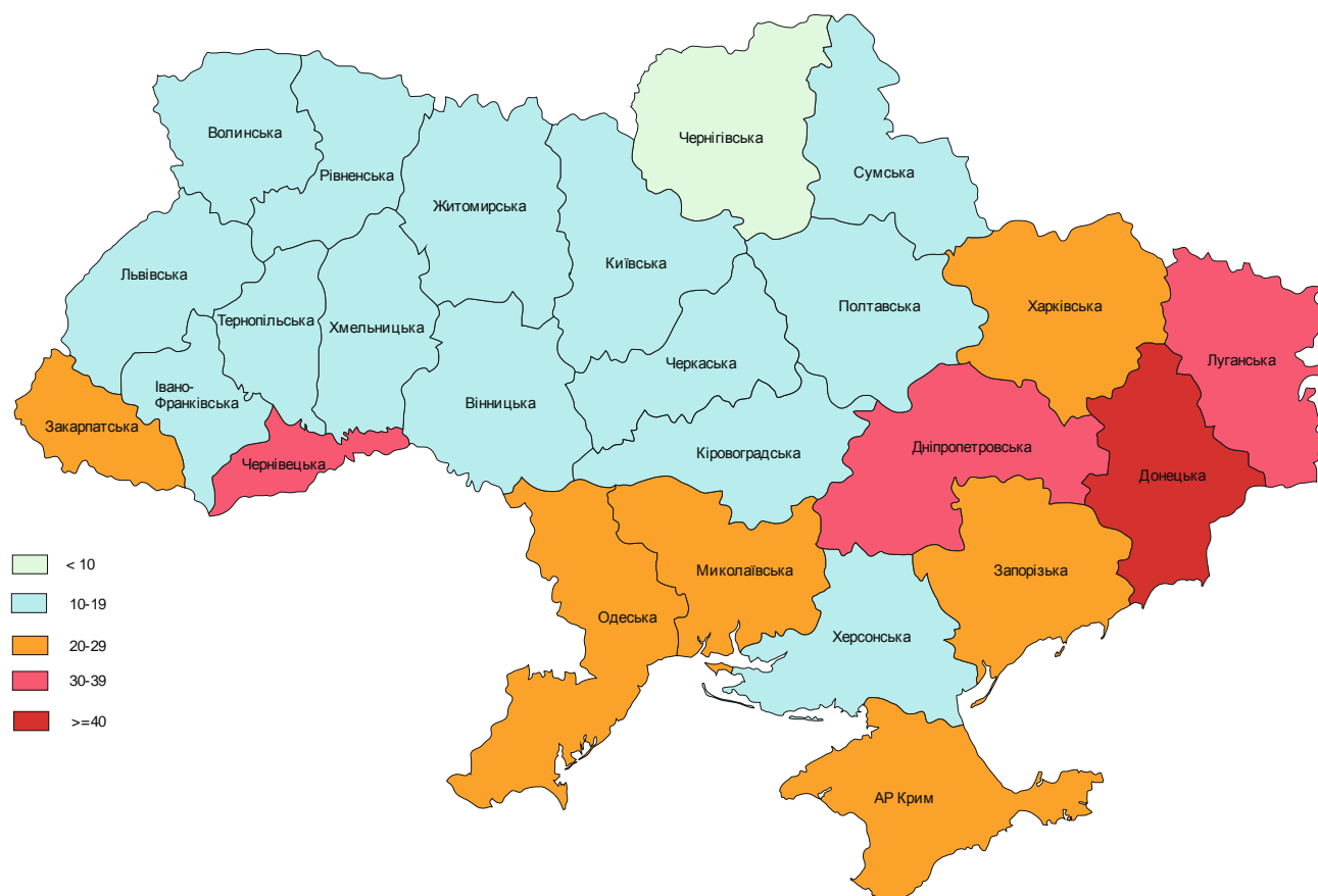
Рис. 9. Щільність злочинів, скоєних неповнолітніми

На жаль, Донецька область єдина, яка має надзвичайно високу щільність за цими показниками. Так, щільність дітей, народжених поза шлюбом, становить 423 дитини на 1 км 2 , що майже у два рази вище ніж середній показник по Україні та у 7 разів вище найнижчого показника по Україні (Тернопільська область – 58 дітей), щільність дітей-сиріт та дітей, позбавлених батьківського піклування, становить 403 дитини, що також у два рази вище середнього по країні показника та у 4,5 рази вище найнижчого показника (Чернігівська область – 88 дітей) (за даними [7, с. 9, 13, 15; 3, с. 11]). Аналогічним є положення з щільністю зареєстрованих злочинів та злочинів, які скоєно дітьми. Якщо в Чернігівській області зареєстровано 298 злочинів на 1 км 2 , що є найнижчим показником по Україні, то в Донецькій області цей показник вище майже в 10 разів (2342 злочину), а це майже в чотири рази більше середнього показника по Україні. Доволі високі показники зареєстрованих злочинів у Дніпропетровській області (1541) та Криму (1277), але й вони є значно меншими ніж по Донецькій області. Також Донецька область «лідює» за щільністю злочинів, скоєних дітьми – 54 злочину на 1 км 2 , що також значно перевищує середній показник по Україні (23), й найнижчий показник, який зафіксовано у Чернігівській області (7) (за даними [3, с. 323, 330, 11]). За щільністю наркоманів та алкого-