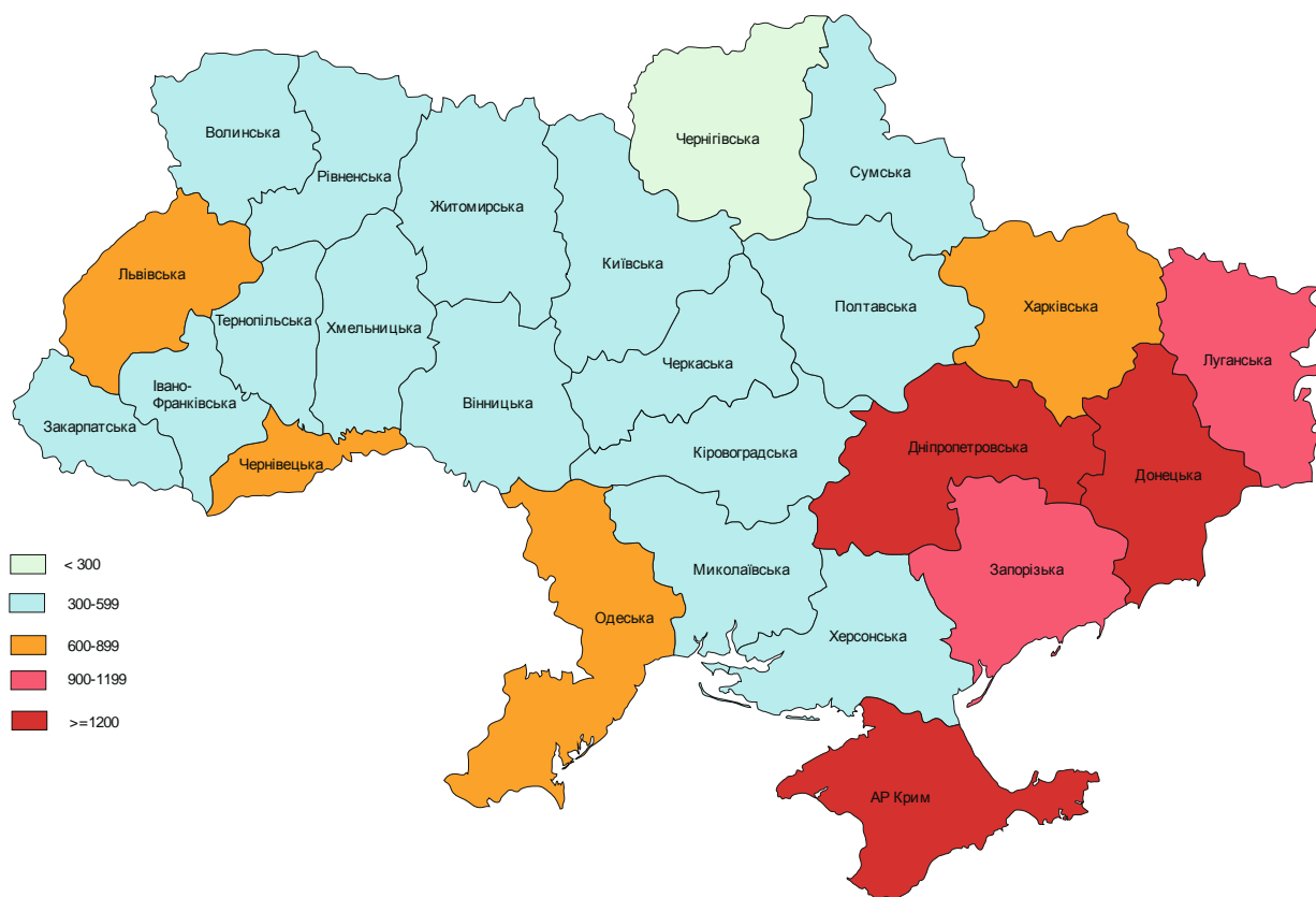
Рис. 8. Щільність зареєстрованих злочинів