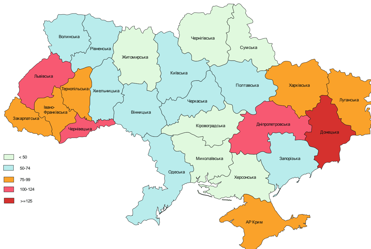
Рис. 1. Щільність населення у 2010 році, осіб на км 2

Треба відмітити, що багато в чому відмінність показників соціально-економічного розвитку Донецької області залежить від найвищої щільності населення на її території (рис. 1), але це не є єдиним та визначаючим чинником такого стану. Виявити місце Донецької області можуть допомогти запропоновані раніше і наведені у статті індикатори, які суттєвим чином визначають соціально-економічний розвиток території, але які не було включено до індексу регіонального людського розвитку.