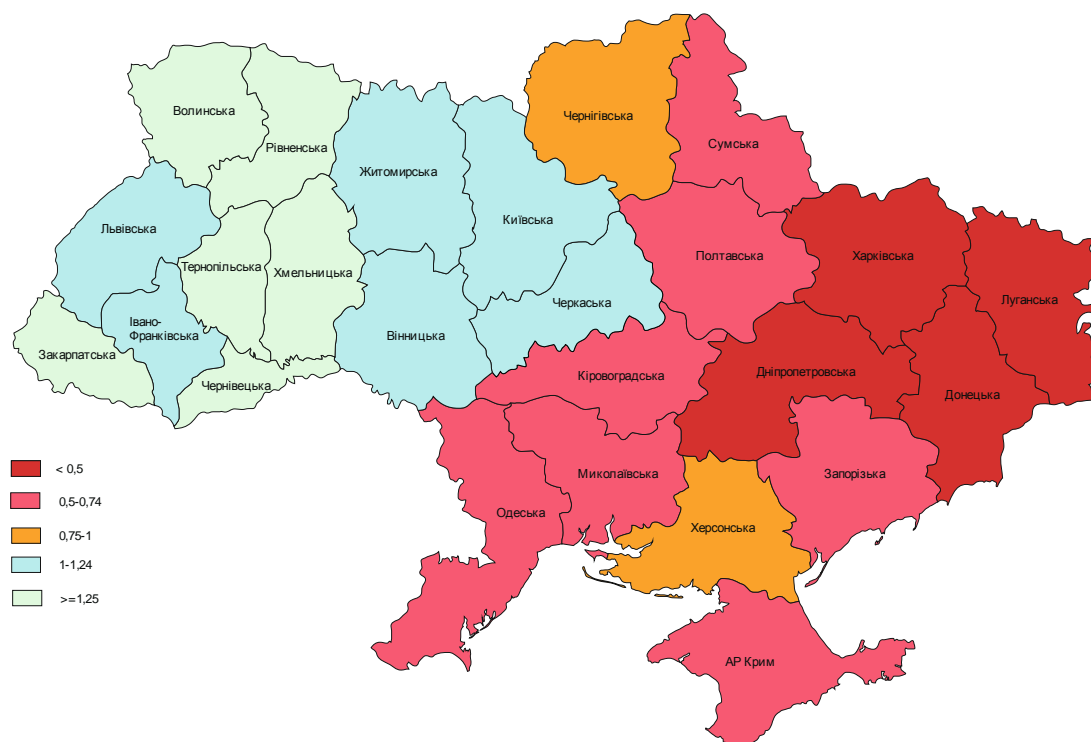
Рис. 5. Насиченість релігійними установами на 1000 осіб станом на 1 січня 2012 року

В Донецькій області індекс рівня розвитку соціального середовища протягом останніх років постійно знижувався і з середнього став нижче середнього. Наприклад, у областях з фактично вже створеною інституційною мережею релігійних організацій (західний регіон) значно нижчий рівень самогубств, щільність наркоманів, розлучень, дітей, народжених поза шлюбом, дітей-сиріт та дітей, позбав-