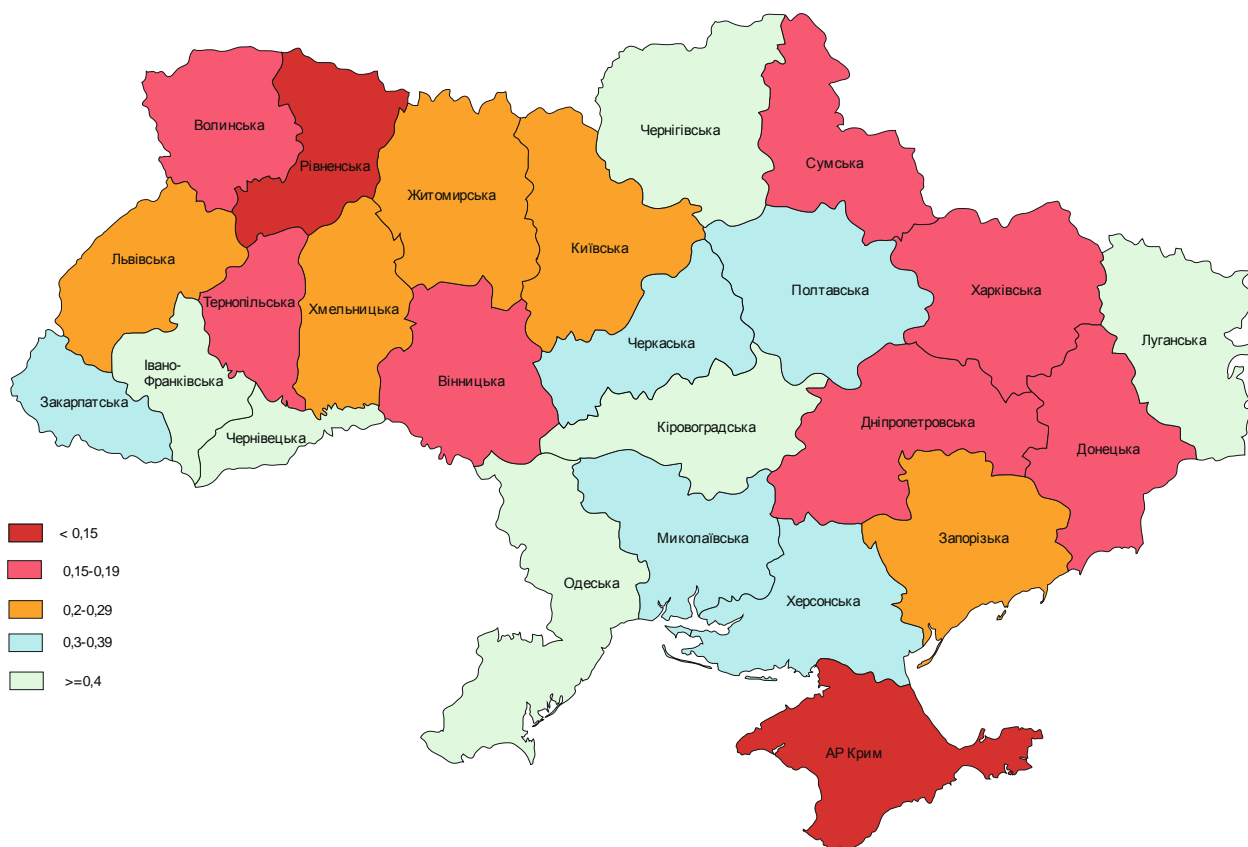
Рис. 3. Насиченість інтернет-провайдерами на 10000 осіб у 2011 році