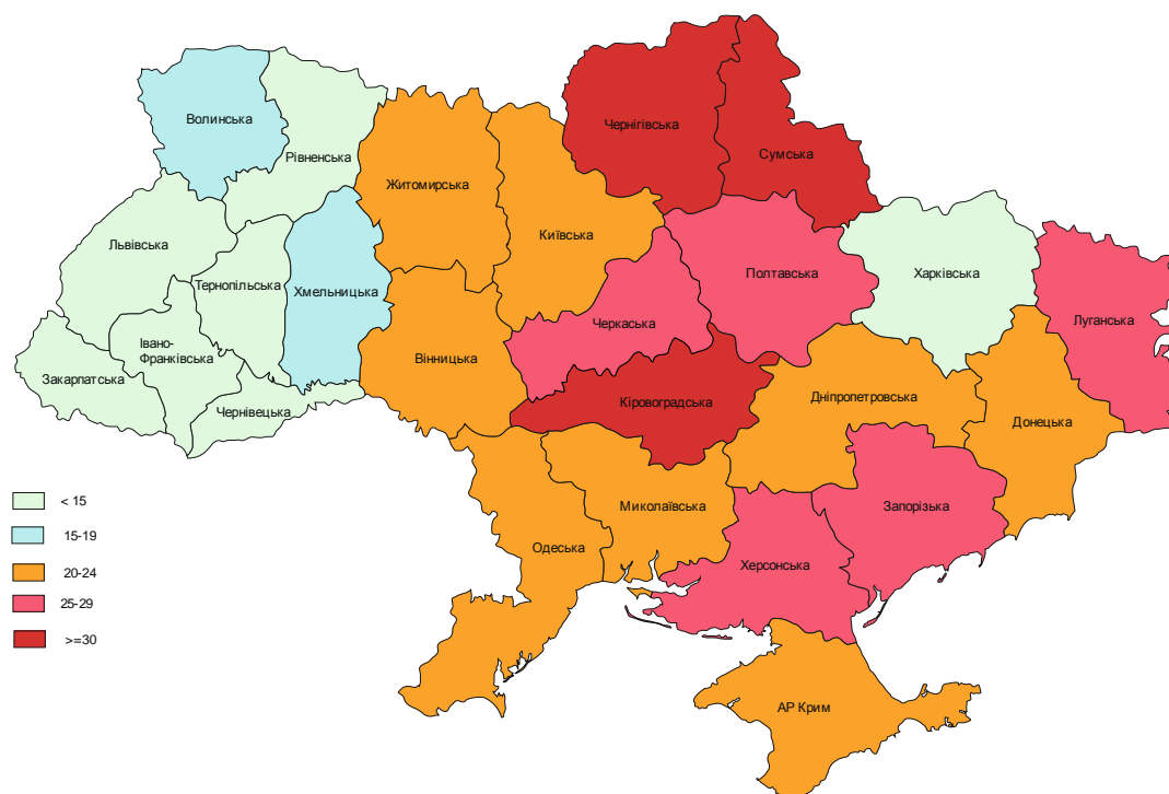
Рис. 10. Коефіцієнт смертності від самоушкоджень у 2010 році