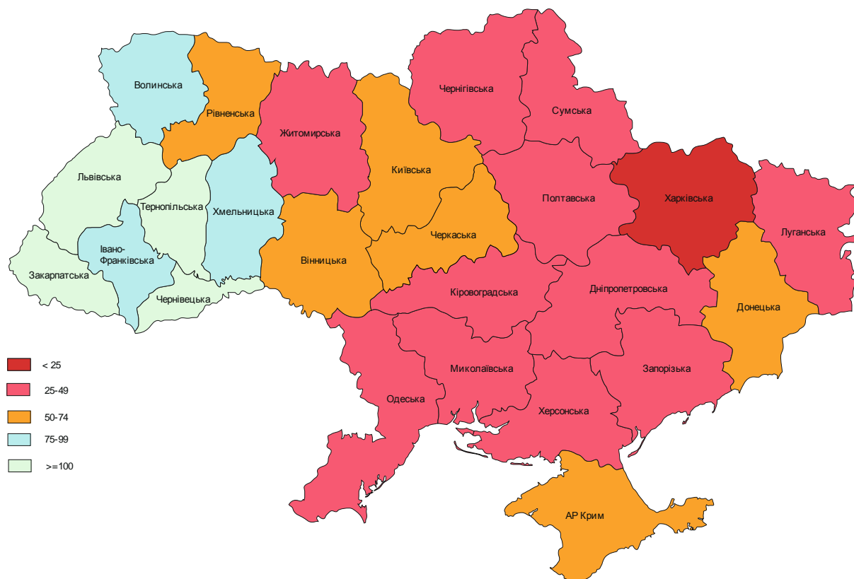
Рис. 4. Щільність релігійних установ станом на 1 січня 2012 року