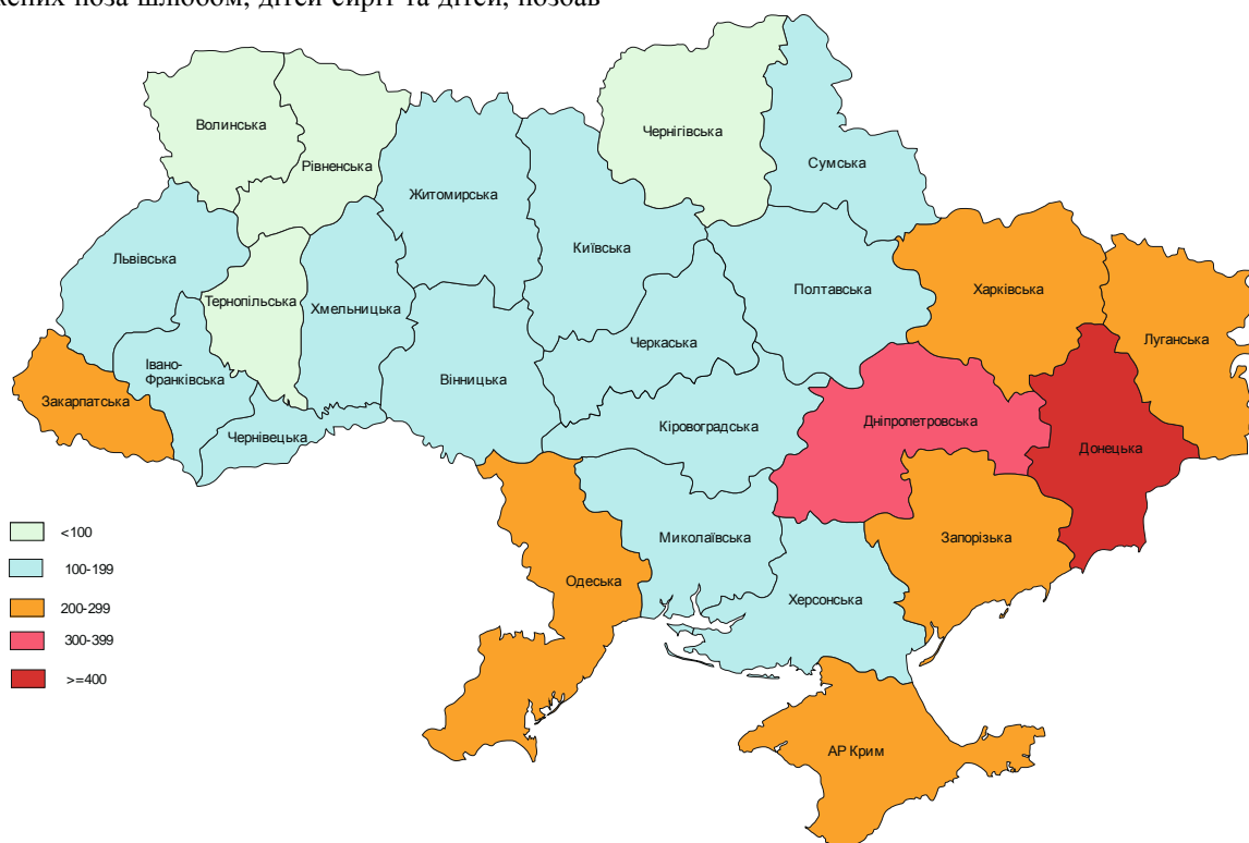
Рис. 6. Щільність дітей, народжених поза шлюбом, у 2010 році

лених батьківського піклування, зареєстрованих злочинів та злочинів, скоєних неповнолітніми. Щільність дітей, народжених поза шлюбом (рис. 6), та дітей-сиріт і дітей, позбавлених батьківського піклування (рис. 7), зареєстрованих злочинів (рис. 8) та злочинів, скоєних неповнолітніми (рис. 9) є наглядним підтвердженням цієї тези.