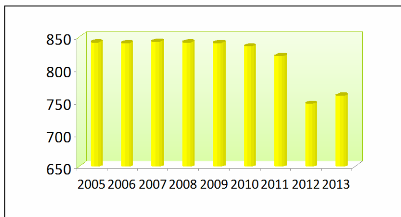
Рис. 2. Динаміка кількості медичних закладів у Сумській області протягом 2005 – 2013 рр.

Чисельність лікарських амбулаторій та АЗПСМ, які надають первинну догоспітальну допомогу, протягом досліджуваного періоду зросла на 22,3%. Станом на 1.01.2014 р. в регіоні налічувалося 155 амбулаторій, у т.ч. 21 – міська (селищна). Найбільшу кількість лікарських амбулаторій мають Сумський (25), Роменський (18), Конотопський (15), Кролевецький (13) та Краснопільський (13) райони, у той час як у Буринському, Ямпільському та Середино-Будському районах є лише по 3 лікарські амбулаторії.