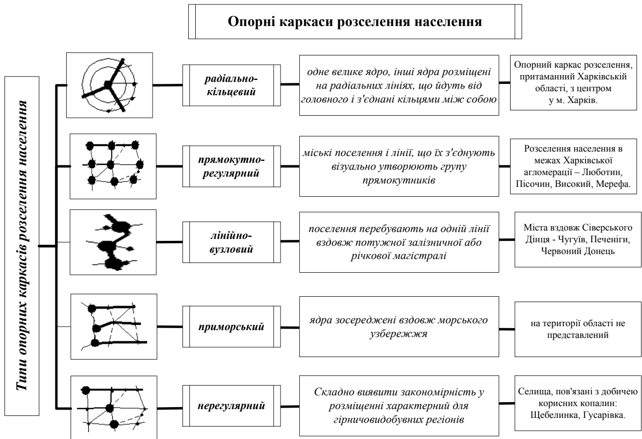
Рис. 1. Опорні каркаси розселення у Харківській області (за Г.М. Лаппо) (побудовано авторами за даними [5, 12])

Сукупність міських поселень регіону, разом з лініями комунікацій між ними, утворює опорний каркас розселення регіону (рис. 1) [5, 13].