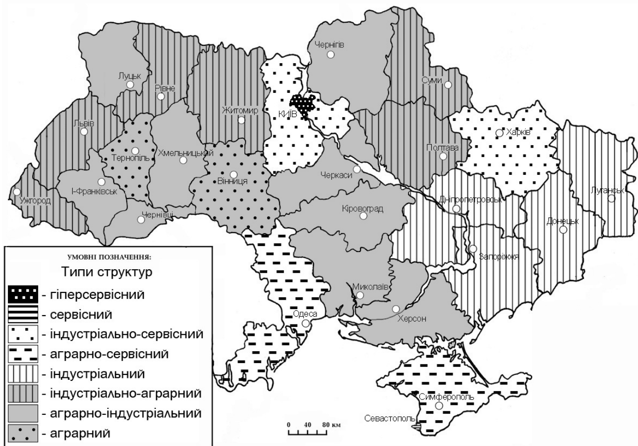
Рис. 2. Регіональні структури зайнятості населення України

Фінляндія, Угорщина тощо), Австралія, Нова Зеландія, Ізраїль, Об'єднані Арабські Емірати, Японія. У нас до групи з подібною структурою потрапляють східні регіони і Придніпров'я: Донецька, Дніпропетровська, Луганська і Запорізька області (рис. 2), у Росії – Сахалін, Приморський край, Томська область, а з європейських її регіонів – Московська область. Варто зазначити, що наприкінці ХХ століття до цього типу входили і названі нижче Полтавська, Харківська, Київська та Львівська області, де станом на 2000 р. частка найманих працівників, що трудилися у промисловості становила 26-45%. Зникнення в Україні гіперіндустріальних регіонів (наприклад, у 2000 р. в промисловості та будівництві Луганської області було зайнято 52,1% населення) і зменшення кількості індустріальних є свідченням процесу деіндустріалізації, що активно відбувається в Україні у ХХІ столітті.