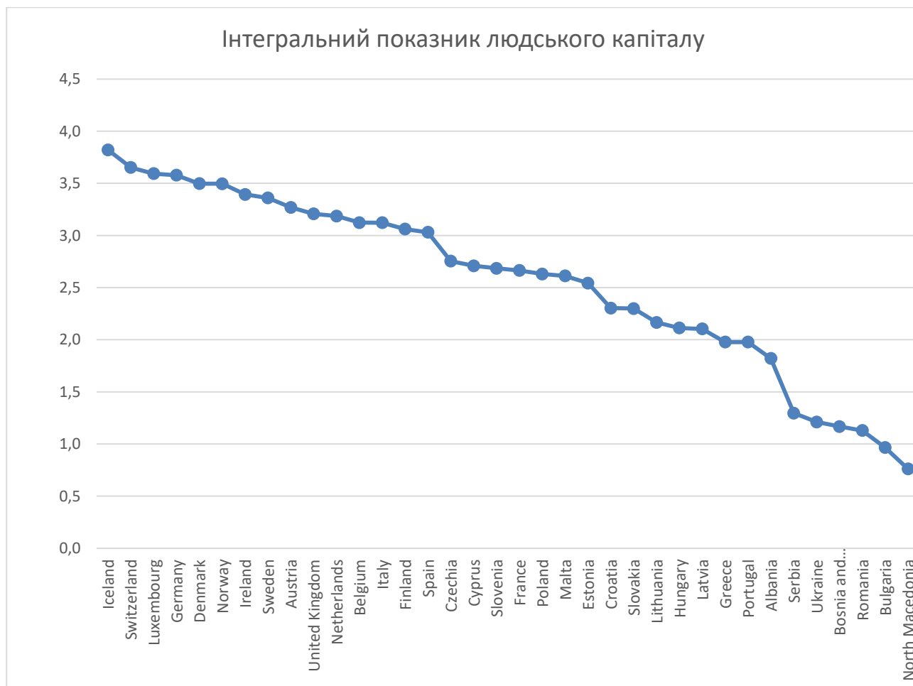
Рис. 2. Ранжування країн Європи за Інтегральним індексом людського капіталу

найвищою Кількістю років навчання у школі для дітей з коефіцієнтом якості освіти, середніми значеннями показників Індекс медичної інфраструктури, Кількість років навчання у школі для дітей з коефіцієнтом якості освіти та Витрати на одного студента у вищій освіті, а також найнижчою Очікуваною тривалістю життя. На рис. 2 представлений Інтегральний індекс людського капіталу, розрахований як сума усіх нормованих показників.