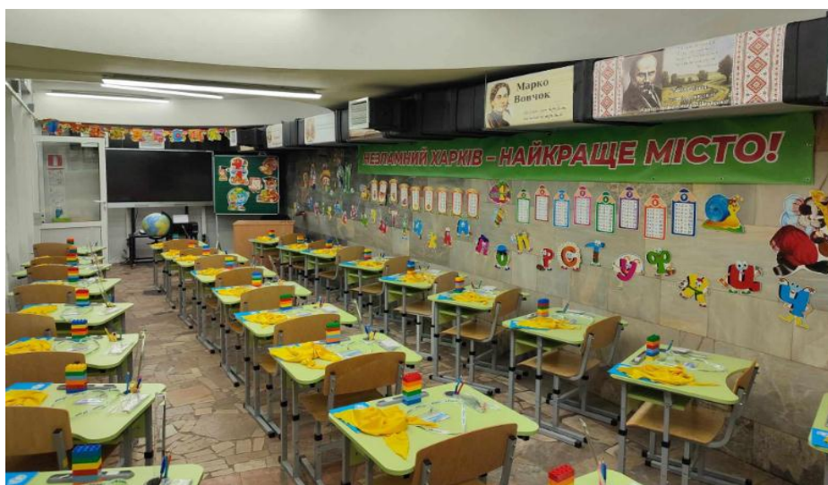
Рис. 4. Підземна школа на станції метро «Університет» у місті Харків [1] Fig. 4. Underground school at the metro station "Universitet" in the city of Kharkiv [1]