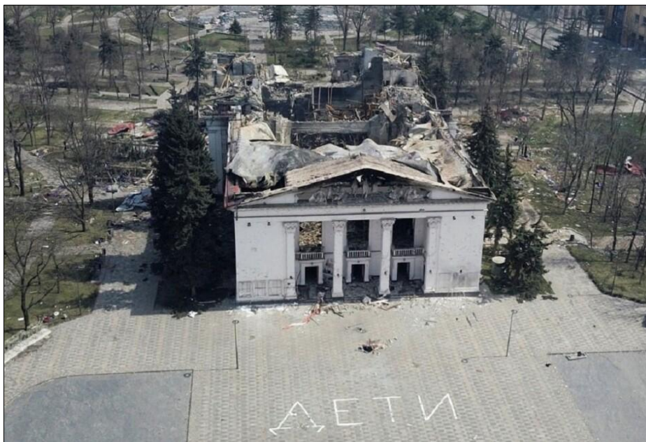
Рис. 1. Зруйнований драмтеатр у Маріуполі (Україна), 2022 рік [2] Fig. 1. The destroyed drama theater in Mariupol (Ukraine), 2022 [2]

У Маріуполі був знищений драмтеатр (рис. 1), пологовий будинок, металургійний комбінат Азовсталь та багато житлових будинків, а згодом практично вся інфраструктура міста.