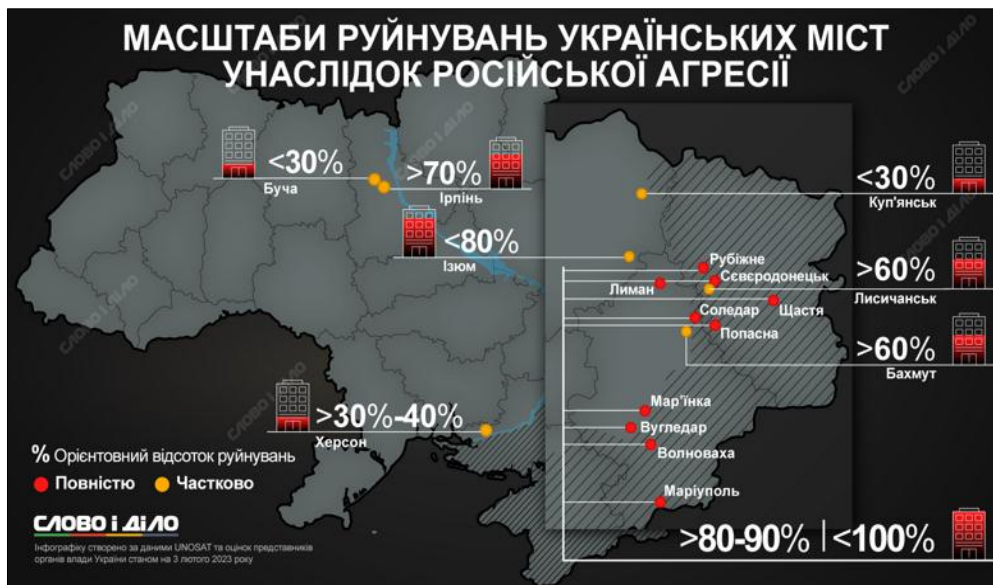
Рис. 2. Зруйновані міста України (станом на 1 лютого 2023 року) [6]

У російсько-українській війні урбіцид є не тільки стратегічним інструментом впливу, але й елементом інформаційної війни та політичної маніпуляції. Російські війська та військово-політичне керівництво використовують урбіцид для впливу і залякування, в першу чергу країн, що допомагають активно Україні. Неодноразово були влаштовані окупаційними військами терористичні акти у таких містах, як, Вінниця (ракетний удар по центру міста), Кременчук (торгівельний центр АМСТОР), Дніпро (житловий будинок), Львів (житловий будинок), постійні терор Харкова та Одеси (по житлових будинках та іншій цивільній інфраструктурі, та багато інших).