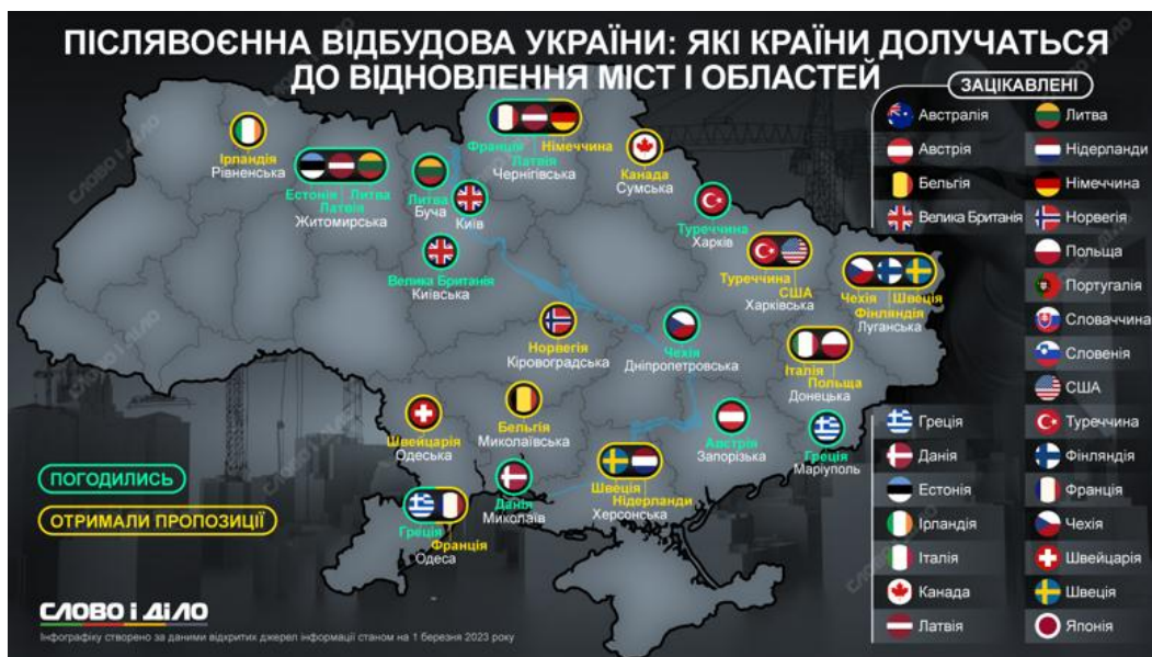
Рис. 5. Країни, що взяли зобов'язання щодо відбудови регіонів та міст України [5] Fig. 5. Countries that have undertaken to rebuild regions and cities of Ukraine [5]

Починаючи з 2022 року деякі країни Європи та світу взяли зобов'язання щодо відбудови різних регіонів України.