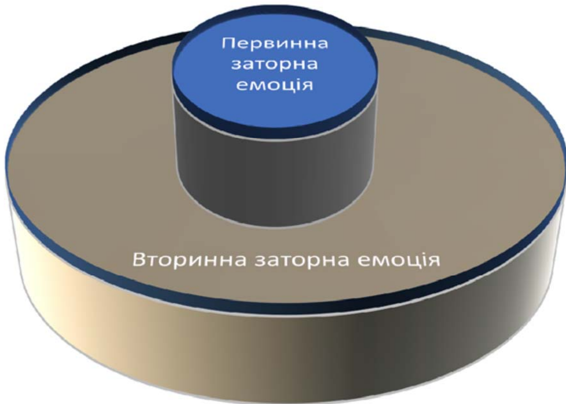
Рис. 2. Топологическая структура «заторного» переживания

Топологическая структура эмоционального «затора» представлена на рис.2.