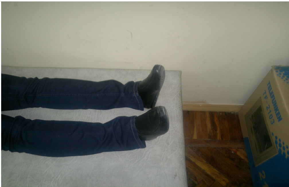
Рис. 3. Голени и стопы клиентки К. (28 лет).

Топография психики эквивалентна психологической топографии тела. Ниже на рисунках 3-5 представлены части тела, в которых отражаются определенные психологические особенности клиентки.