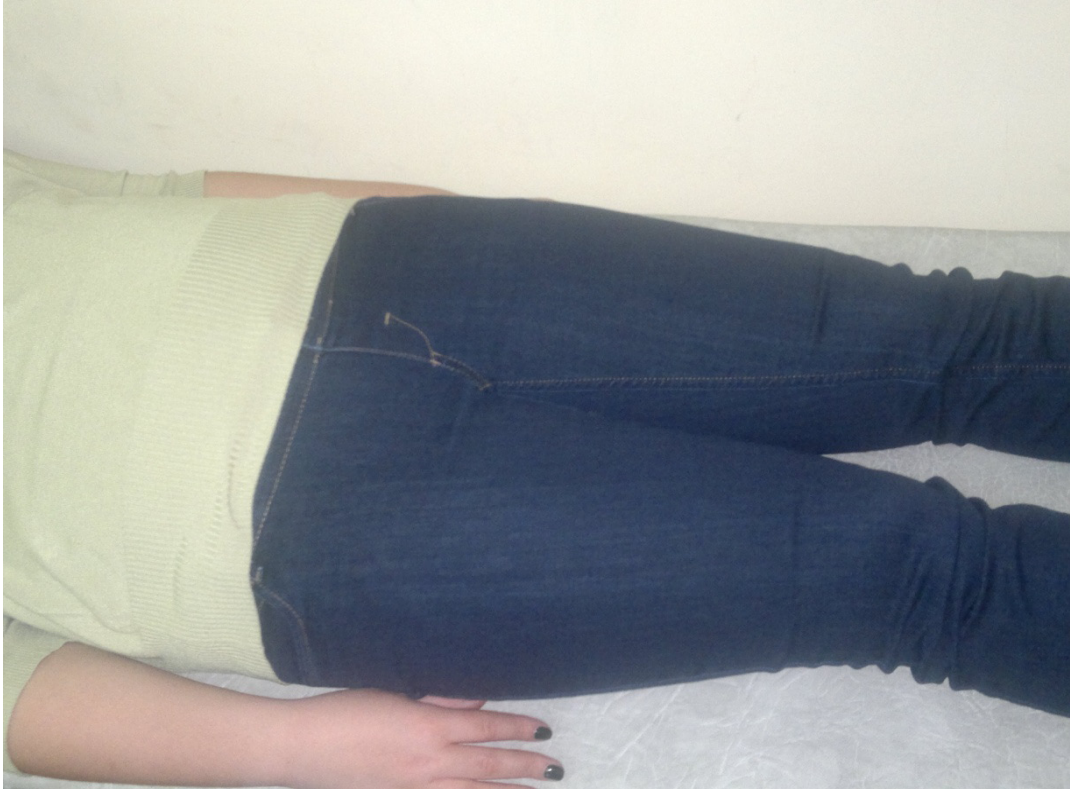
Рис. 4 Бедра той же клиентки К. (28 лет)