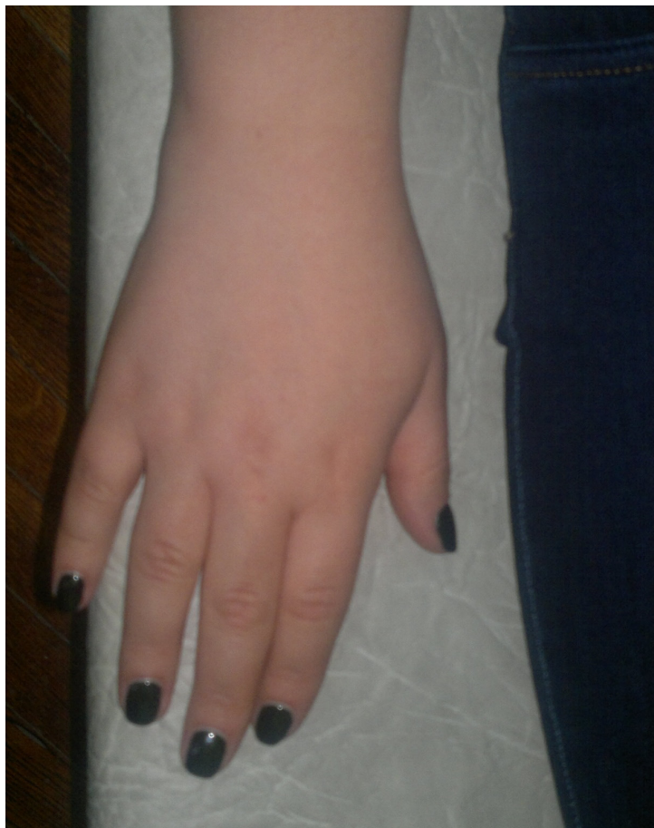
Рис. 5. Кисть клиентки К. (28 лет).