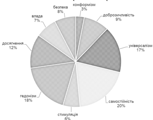
Рисунок 2. Пріоритетні цінності / Priority values

Інтерпретація статистичного аналізу за методикою "Портрет цінностей" Ш. Шварца (в адаптації І. Семків) дає нам можливість зробити такі висновки: в період юнацького віку найбільш притаманними для особистості виступають ті цінності, що пов'язані зі здоровим егоїзмом, індивідуалізацією, досягненнями, задоволенням від життя та рівністю прав для кожного.