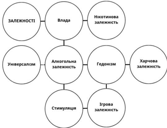
Рисунок 4. Кореляційна плеяда зв'язків між цінностями та залежностями. Частина 2 / A correlational constellation of relationships between values and addiction. Part 2.

Між цінністю самостійність і залежністю від здорового способу життя віднайдено помірний прямий зв'язок ( r=0,34 ; p<0,001 ), що може пояснюватися тим, що наявність тенденції до ідеалізованих фізичних форм може виступати сферою, на яку особистість здатна впливати та контролювати, що є важливим в контексті цінності самостійність.