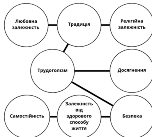
Рисунок 3. Кореляційна плеяда зв'язків між цінностями та залежностями. Частина 1 / A correlational constellation of relationships between values and addiction. Part 1.

Для віднайдення взаємозв'язку між цінностями та схильністю до залежностей використано кореляційний аналіз за критерієм Пірсона, який дозволив виміряти лінійну кореляцію між двома наборами даних. Результати кореляційного аналізу відображено за допомогою двох кореляційних плеяд, що зображені на рисунку 3. та рисунку 4.