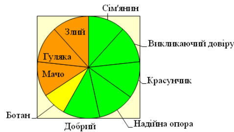
Рис.2 Групи чоловіків у жінок із континуально – альтернативною статевою рольовою структурою. Примітка: ■ - позитивна оцінка, ■ - негативна оцінка, ■ - нейтральна оцінка.

Як видно із рис. 1, жінки із андрогінною статевою рольовою структурою позитивно оцінюють групи чоловіків, які мають різноманітні вади, які стосуються стереотипних образів («ботан», «мачо»), характеристик поведінки («впевнений», «невпевнений», «невдаха»), зовнішності («красунчик») та тих характеристик, які проявляються в стосунках із жінками («викликаючий довіру»). Це свідчить про широке коло інтересів жінок і вміння розглядати в партнерові позитивні риси. Крім того на вибір партнера у жінок з андрогінною моделлю слабо впливають соціальні стереотипи, вони схильні позитивно оцінювати різні групи чоловіків, не поділяючи їх на дихотомічні класи. Варіативність виборів також може бути зрозуміла як прояв психологічної зрілості.