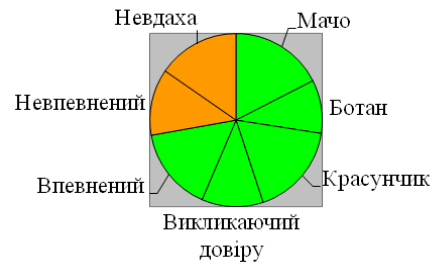
Рис. 1 Групи чоловіків у жінок із андрогінною статевою рольовою структурою. Примітка: ■ - позитивна оцінка, ■ - негативна оцінка.

Як видно із рис. 1, жінки із андрогінною статевою рольовою структурою позитивно оцінюють групи чоловіків, які мають різноманітні вади, які стосуються стереотипних образів («ботан», «мачо»), характеристик поведінки («впевнений», «невпевнений», «невдаха»), зовнішності («красунчик») та тих характеристик, які проявляються в стосунках із жінками («викликаючий довіру»). Це свідчить про широке коло інтересів жінок і вміння розглядати в партнерові позитивні риси. Крім того на вибір партнера у жінок з андрогінною моделлю слабо впливають соціальні стереотипи, вони схильні позитивно оцінювати різні групи чоловіків, не поділяючи їх на дихотомічні класи. Варіативність виборів також може бути зрозуміла як прояв психологічної зрілості.