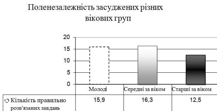
Рис. 2 Показники полenezалежності засуджених різних вікових груп.

Урахування віку досліджуваних демонструє тенденцію щодо більш високої полenezалежності у середньому віці, та її нижчої виразності в старшому віці (Kruskal-Wallis test: H(2, N=120)=5,593812 p=0,0627 ). Таким чином, виявляється що віковий чинник більше пов'язаний з такою психологічною характеристикою досліджуваних, як полenezалежність, ніж чинник першого або повторного скоєння злочину.