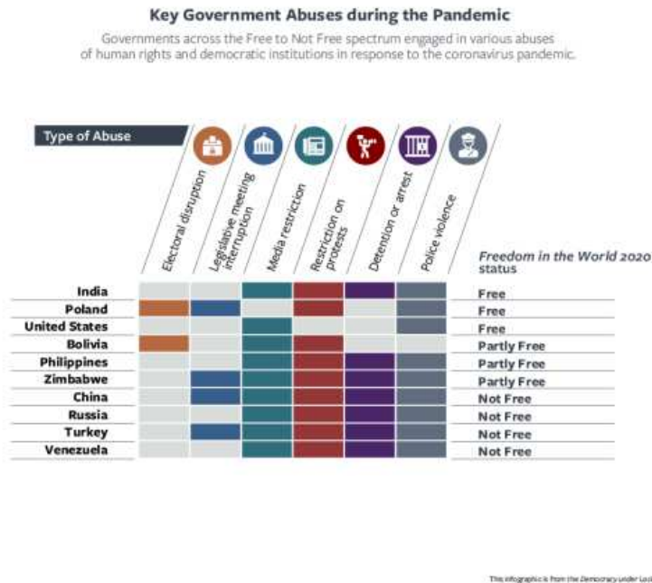
Рис.2 (Nations in Transit 2021)

гостро ця проблема постала перед перехідними демократіями та напівконсолідованими автократіями (див. рис.2)