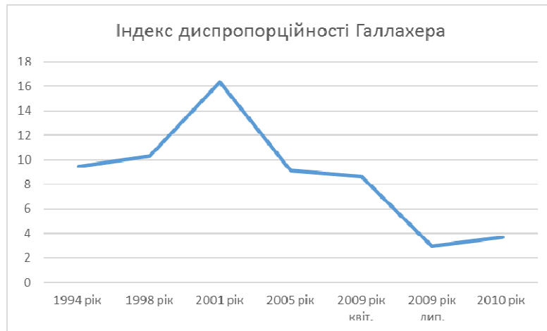
Рис. 2. Динаміка індексу диспропорційності Галлахера для молдавського парламенту

Отже, як бачимо, за останні роки, Молдова постійно змінює свій індекс. Вона змогла побувати в усіх рівнях диспропорційності. Причому зміни були доволі різкі. У 2019 році результати індексу вийшли на рівень 2005-2009 років.