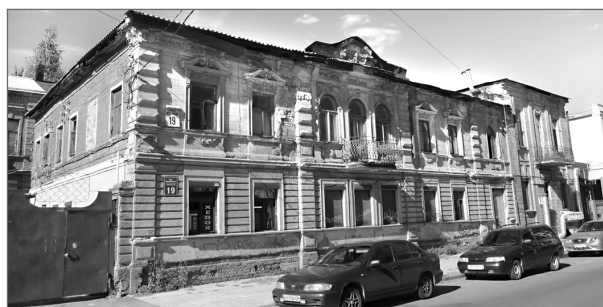
Здание по ул. Куликовской, 19 в Харькове, в котором жил Владислав Дзержинский (современный вид).