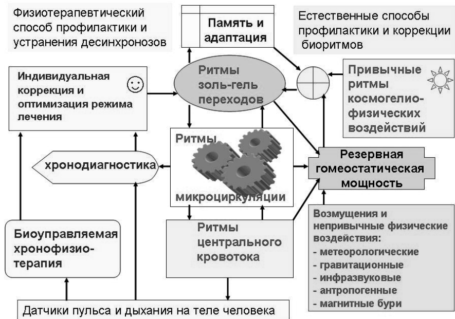
Рис. 2. Схема хронодиагностики, профилактики неблагоприятных реакций организма человека на непривычные внешние воздействия и устранения десинхронозов

Обычные способы физиотерапии не учитывают фазы биоритмов чувствительности и смещений