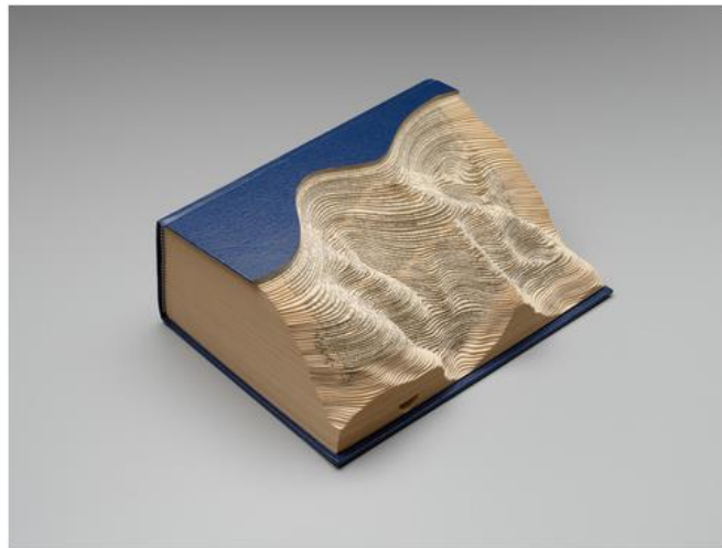
Megan Williams. Altered Book Landscape (1992)

Returning to the question of literature as one of the arts, it is worth mentioning another possibility of its theatricalization, literature without literary. These are artbook – sketchbooks, ezines, portfolios, brand books and especially altered books (see illustrations). They often become the theatrical scene or even landscapes of living through, which both enriches the senses of the book as a theatrical object and resists redundant postmodern theorizing in favor of post-postmodern eventfulness and self-happening. In this regard, the following circumstance is indicative. One of the most famous datings of both postmodern and post-postmodern beginnings is associated with the alteration of space, air space in particular. In the first case, it was a recognition of the inappropriateness and destroying of a functionalist housing complex Pruitt-Igoe in St. Louis by Minoru Yamasaki. In the second case, it was an attack on Twin Towers in New York, also projected by Minoru Yamasaki. At the same time, even in comparison with the brand books of IT-companies such as Next, the more landmark brand books are NASA, British Airways and Lufthansa.