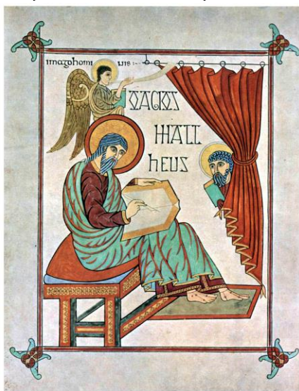
Святий Матвій пише Євангеліє. Фрагмент з Ліндісфарнського Євангелія. Кінець VII століття, Нортумбрія, Англія.

за межі репресивних соціокультурних практик універсализації чи тоталітаризації, а відтак: «Єдиного цілісного природного суб'єкта чи особистості, яку потрібно відтворювати чи наслідувати, не існує. Є лише частковість денатуралізованої множини, що перебуває в трансформаційному процесі само(ре)презентації...» [Перепелиця, Храброва 2022, с. 80].