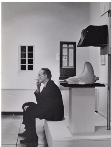
Джуліан Вассер. Дюшан куриць перед Фонтаном. Ретроспектива Дюшана. Художній музей Пасадени, 1963 р. Галерея Роберта Бермана

«суть християнського авторства ... полягає в «самозреченні», себто навіть «більш суворому стиранні, ніж іронічна стратегія псевдонімізму», тож і писання/творчість лише засвідчує зв'язок із Богом, який є утаємниченим – таїнством екзистенції як єднання з Богом [Ibid., p. 295], але, з іншого боку, йдеться й про подвійність (Dupliciteten або Tvetdygheden), принаймні поетично-релігійну, «авторства», яку неможливо усунути, якщо ми визнаємо екзистенцію саме як процес становлення і вибору, чи навіть як здійснення одиницності. Автор зникає, навіть попри свідомий досвід певної особистості, адже твір постає в процесі виробництва/становлення, що задається розгортанням певної ідеї, чи низки ідей/п'ям (як от: естетичних, етичних і релігійних), яким потрібен своєрідний «безбарвний хімікат без запаху» [Ibid., p. 300], аби здійснити вибір щодо власного становлення іншого(/)іншим. Безперечним досягненням цієї думки, по-перше, є відділення функції автора від авторитетності (саме псевдоніми засвідчують множинність екзистенційних шляхів життя, не виносячи вердикт), по-друге, відділення творчості «автора» від становлення екзистенції, набуття власної одиницності/автентичності.