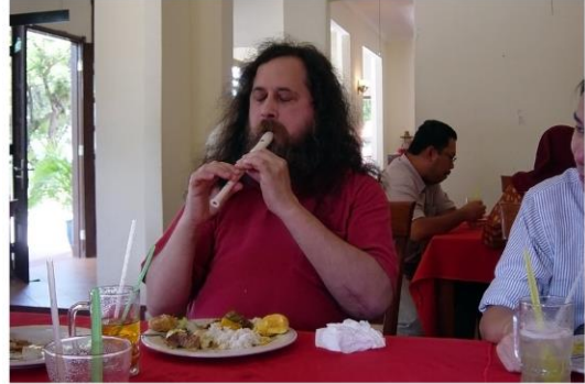
Річард М. Столмен. Пінанг. 2005 р.